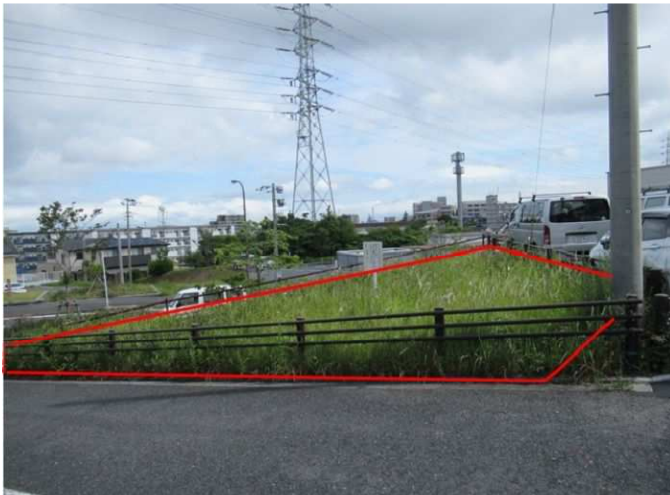
現地写真(南西から撮影) 小倉北区都一丁目99番168