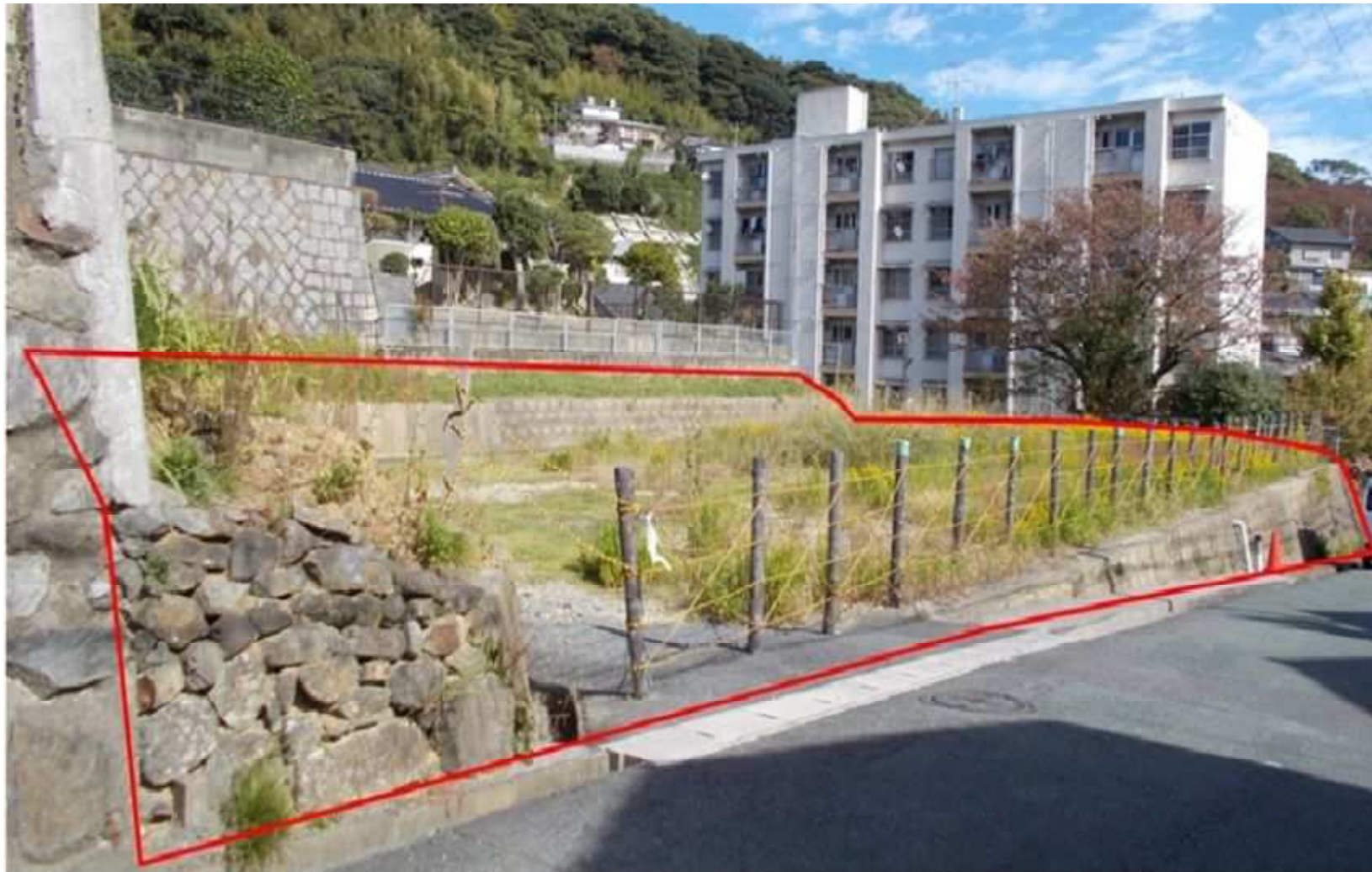
現地写真(南西から撮影) 若松区 今光二丁目8番8