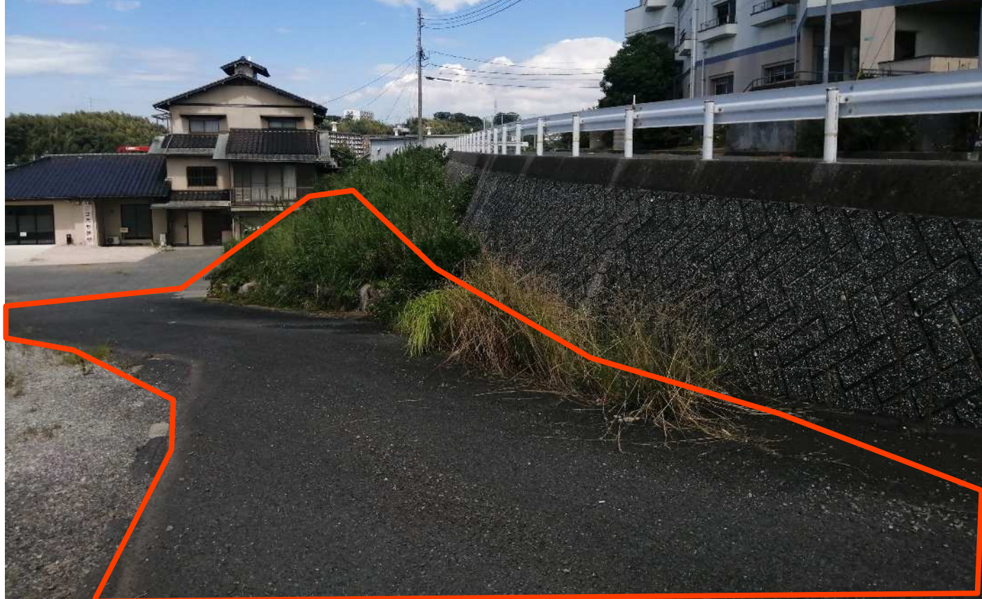
現地写真①（南から撮影）