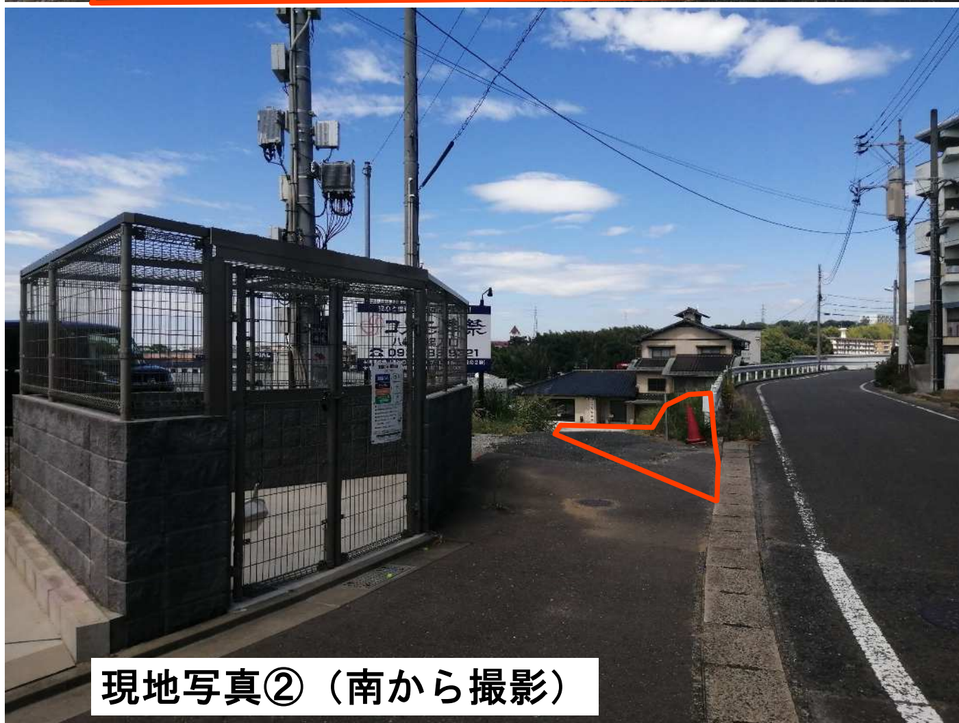
現地写真②（南から撮影）