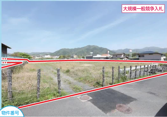
大規模一般競争入札