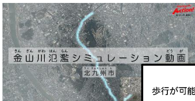
「金山川氾濫シミュレーション動画」一部抜粋画面