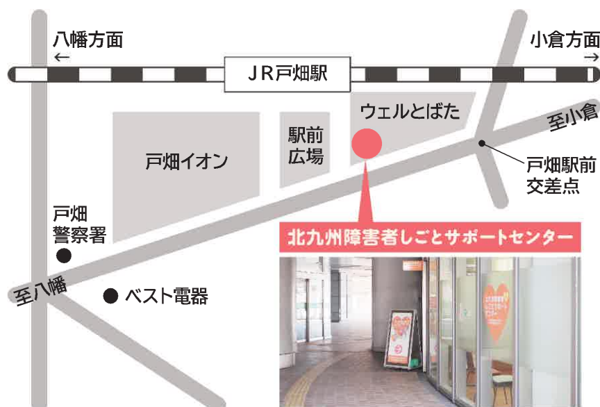
ウェルとばた2階 多目的ホール横