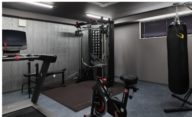
本社に併設されたトレーニングルーム

当社では資格取得に関わる費用も、（回数制限はありますが）全て会社負担で支援しています。