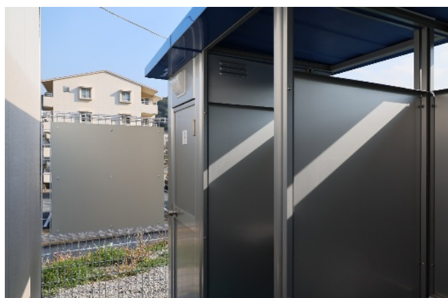
工事事務所にも女性専用トイレを設置