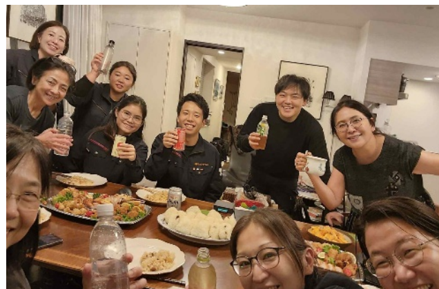
社員全員で昼食を食べるのが長年の習慣

これからも、人と技と自然が繋がり、あらゆる立場の人が歩いて参加できる建設・ものづくり・まちづくりの未来像を、会社のビジョンとして示していきたいと思っています。