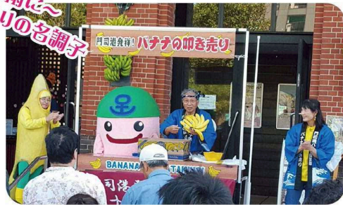
※ バナナの叩き売りは8日・9日もやってます!