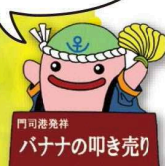
門司港発祥 バナナの叩き売り