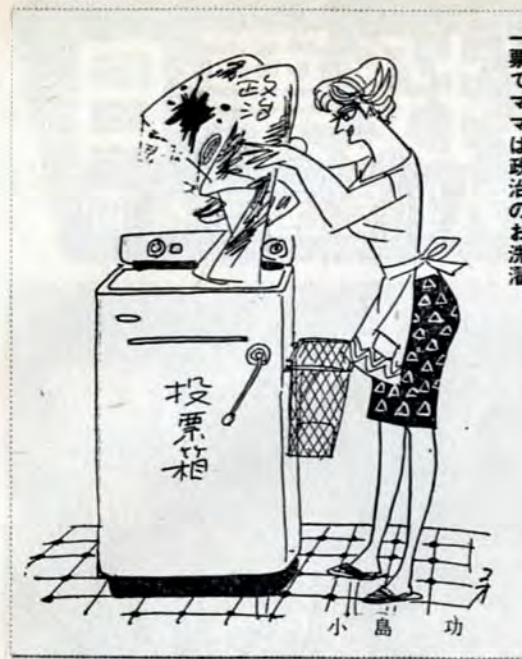
一票でママは政治のお洗濯

義理や人情、買収、供応によって投票することなく自信をもって、堂々と投票しましょう。