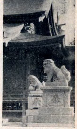
浅生八幡神社のこまいぬ