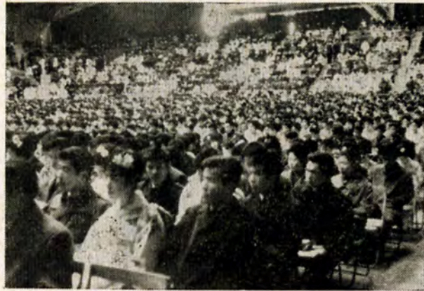
若ものたちは巣立ってゆく きょうの佳き日…。

〇はたち〇になつた成人のみなさん、おめでとう！ 満二十歳は、人間の一生のうちで、社会的に一人前として認められて、選挙の権利を与えられるのです。満二十歳からは、おとなとしての責任と義務をもち、政治に参加することができます。