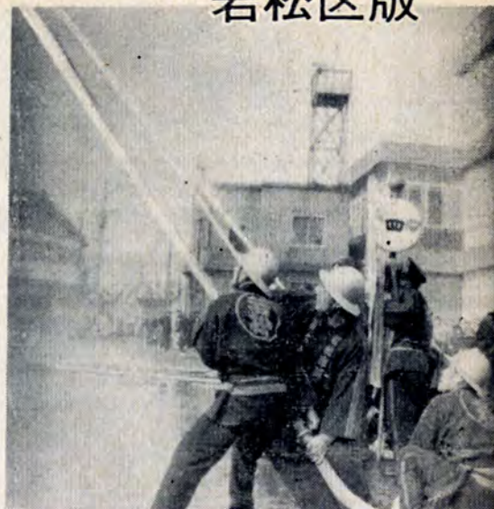
火魔吹っとなと勇ましい放水 (消防団出初め式、1月8日区役所前)