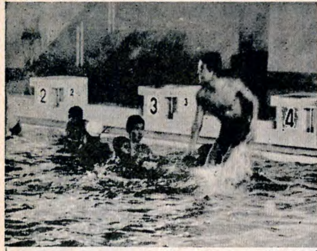
「ワイイ温かいぞ」 温水プールを一般開放 利用は11時→18時

北九州市水道局が、1月1日から発足し、本市の水道行政は文字どおり一つになりました。いままでは市門司水道部と門司区を除く四区を旧市と県で組織された北九州水道企業庁で、それぞれおこなってきました。