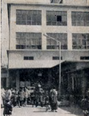
関門国道トンネルの めかり人道口