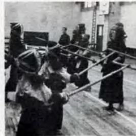
豆剣士もまじって剣道教室 (門司体育館で)

図書館からおねがい 図書館では、いま本の収集に全力をあげていますが、絶版になったものや珍しい本などもあって苦勞しています。このような本をお持ちの方は、ご寄贈いただければ幸いです。(連絡は市立門司図書館へ)