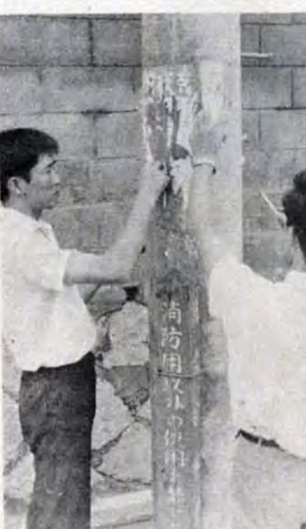
ベタベタはりついて、なかなかはげない電柱のポスター

世をあげての広告時代、町を歩けば目立つのがポスターや広告看板です。人の迷惑も考えず家の壁や電柱などにベタベタはったものにはうんざりです。 市では、市屋外広告物条例で、はることを禁止されている場所にはり出されているポスターや、はり紙を年四回、一回につきのべ百二十〜三十人を動員してはることにしており、現在も市内各地域をまわってはいけません。 橋や街路樹、公衆便所等に広告物を表示することは禁止されてお