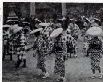
大名行列をしのぶ宿場踊り

木屋瀬町が旧八幡市に合併して10周年、これを祝って7月10・11日に祝賀会、宿場おどりの発表会がひらかれました。この日は須賀神社の夏まつりなので、子どもみこしも出て、町中がたいへんにぎわいました。