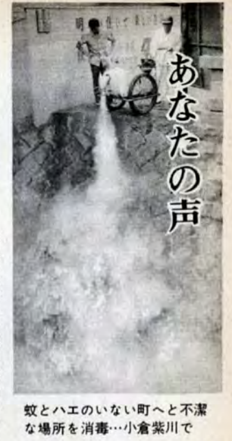
あなたを悩ます蚊とハエのいない町へと不潔な場所を消毒...小倉紫川で