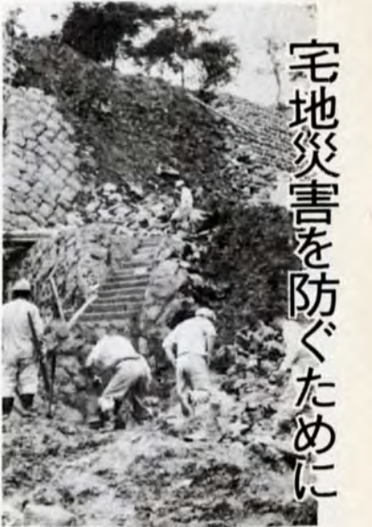
ガケくずれを起した八幡区丸山町の新宅造地