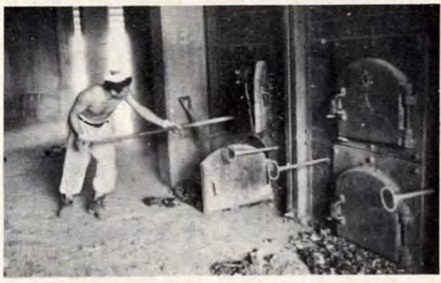
灰落しは一日二回、雨の日の濡れたごみは、ことさら燃えにくい。