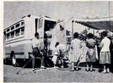
風師号の検診(丸山公民館前で)