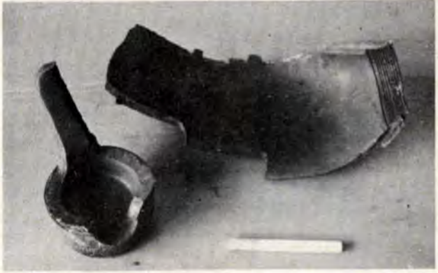
8月12日に同工場焼却炉内で爆発した旧陸軍の砲弾。手前はタバコ