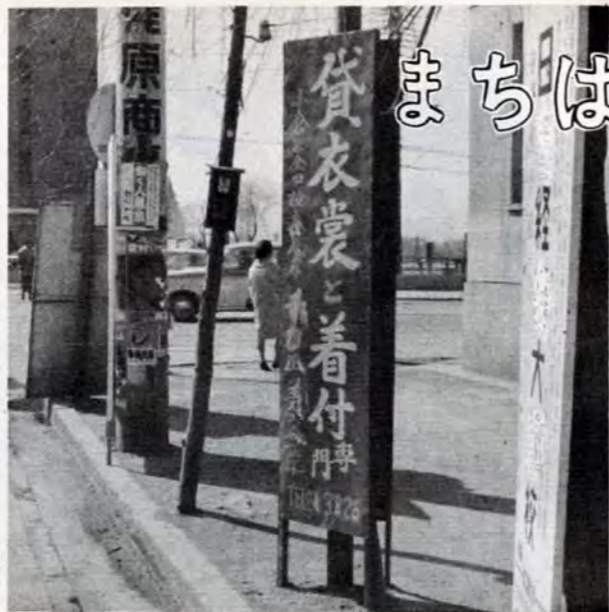
写真のポスター、看板類はすべて違反しています

この規制法では、施設の種類の別により、十五にわけ、ばい煙や亜硫酸ガスの排出基準を定めてあります。 これまで、とくにばい煙や亜硫酸ガスなどのひどかった北九州をはじめ京浜、阪神の三大工業地帯が、38年9月1日から二年間の猶予期間つきでこの規制法の第一次適用地区に指定されてきました。 9月1日から、規制法に違反すると県知事や市長が改善命令を出し、従わないときには操業を一時停止するなど、きびしい監視や取締りが行なわれます。 本市では、この猶予期間中に、規制の対象となる工場・事業所五百三十五施設に対して防じん装置の取り付けや燃料の切りかえ、炉や操業の改善などの指導を続けてきました。この結果、対象工場のほとんどが規制法にふれないように改善されました。このようにばい煙の排出が抑えられてきたため、ばい煙の量も年々減り、五年前にくらべ約二五%少なくなっています。しかし、最近、燃料を石