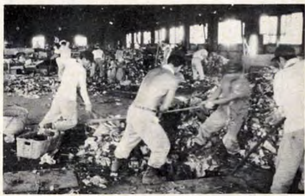
焼き具合に応じてゴミの投入量を調節し、火かき棒で炉内をかきまわす。