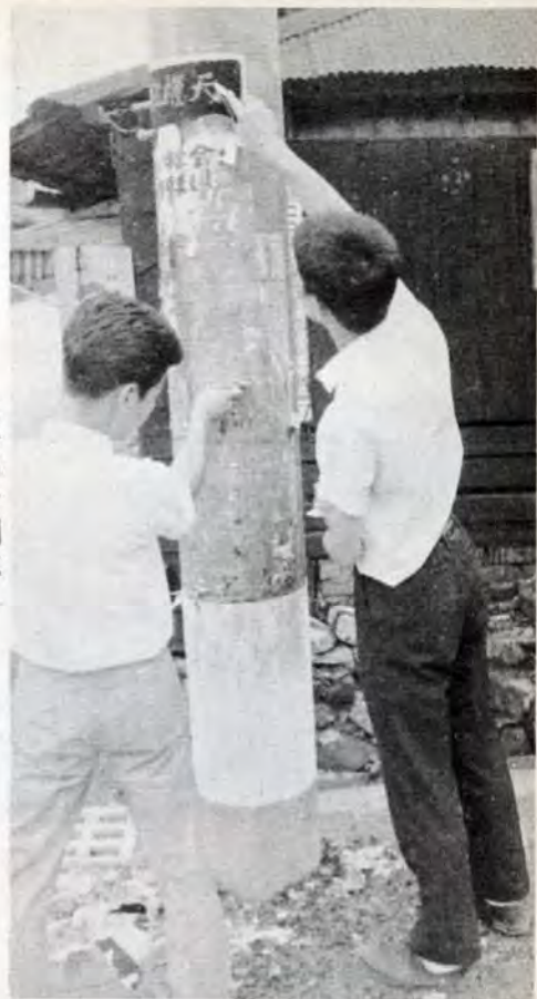
市では、年4回、のべ600人でおもに電柱の違反ポスターをはいていきます。

世はあげて宣伝時代…新聞を開けば折込みチラシ、茶の間のテレビは調子の良い? コマーシャル、また、一步まちに出るとポスターなどは紙、看板が、ところかまわず掲示され、いやおうなしに目に飛び込みます。なかには、人や車の迷惑もおかまいなしに道路にはみだした立看板もあります。 広告の七割は許可を受けていない こうした乱れた町の「顔」を整理するために、広告は特定の場所に出すように規制したり、美観をそこなうような広告は、もっと品よく、アイデアで競っていただくように業者の方におねがいするわけです。 市では、昭和38年4月から屋外広告物条例を施行しています。町の美観をそこなわず、公衆に危害を及ぼさないようにする(同条例第一条)ために、一定の場所や建築物に広告を掲出しないようにきめ(第二条)また、禁止外のところに出すときも、市長の許可を受けて出す(第三条)ように定めています。 しかし、現実には、市内に掲出されている広告類の約三割は違反個所にだされておられ、許可を受けていないものが約七割にもなっています。特等なものを除いて、自分の店の表示や広告を、店頭あるいは敷