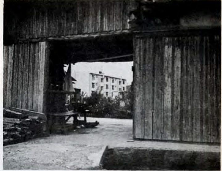
宅地ブームは市街地をなめつくし、農家の庭先へ…家を建てたいが宅地がない。市内では34,000戸の住宅が不足。(八幡区永大丸で)

家を建てるときは、建築基準法という国の法律に従って工事をしなければなりません。ところが宅地を造るときは、別にこれといった法律もなく、さいきんまでは、いわば野放しの状態でした。