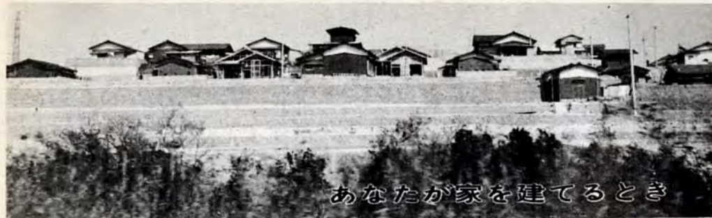
あなたが家を建てるとき