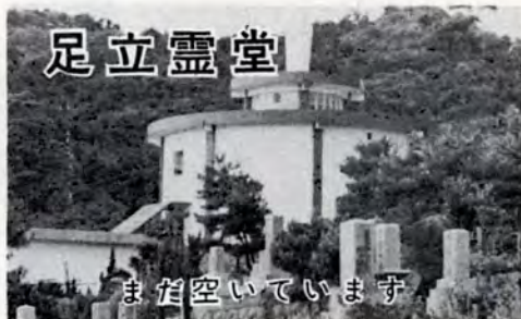
まだ空いています

足立墓地の北側にある足立霊堂(納骨堂)は、まだ少し空いていますので使用希望者を募っています。霊堂は円型の鉄筋コンクリート二階建てで、家族納骨壇(平均八体収蔵可能)や、焼骨だけをあずかる短期保管棚、忌日の法要に使用する式場、休憩室などが完備しています。