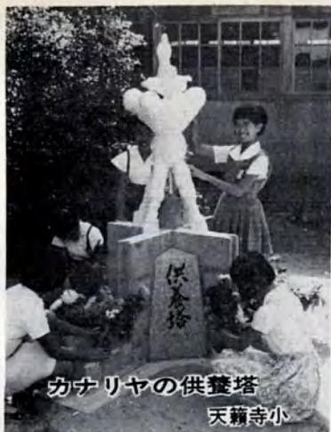
カナリヤの供養塔 天籟寺小

観音像を型どった白い「カナリヤの供養塔」が天籟寺小学校の中庭にできました。この塔は、同校で飼っていた母カナリヤが4羽の子どもをかえして一週間目に、ちょっとした不注意から死んだものをわびようと、児童会で話したものを募金でつくったものです。子どもたちが持ってきた花でいつも飾られています。このやさしい心が通じたのか、育たないだろうといわれた生まればかりのカナリヤも父カナリヤの世話で立派に育っているそうです。