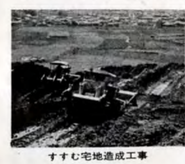
すすむ宅地造成工事