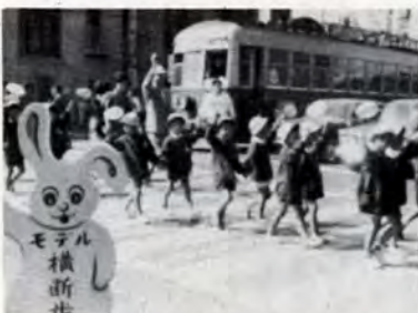
手をあげてウサギも協力(中央町)

きょうは交通安全運動日、「車を運転するおじさん、ご苦労さま」ボクは手をあげ、おじさんに合図して、横断歩道をわたります。