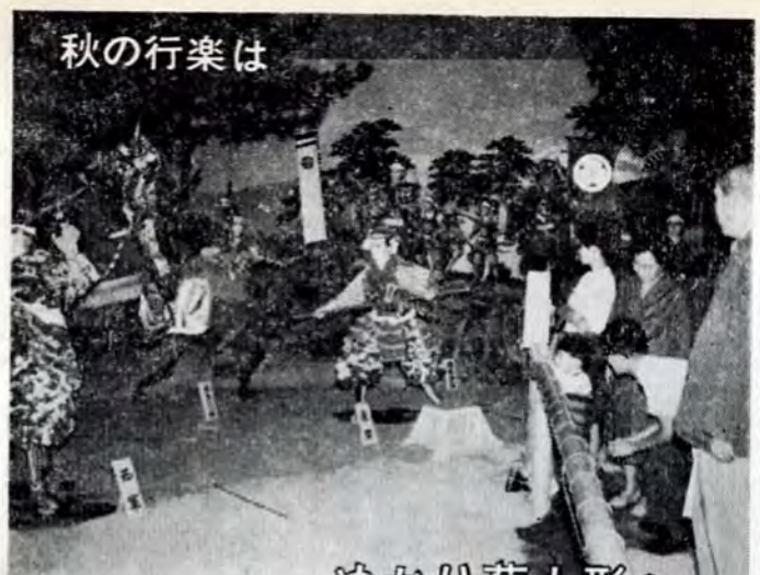
秋の行楽は 菊人形めぐり

法律人権特別相談 土地、家屋の貸し借りや明け渡し、金銭貸借戸籍、人権のもめごとの解決に。相談員は人権擁護委員、弁護士、法務局員です。