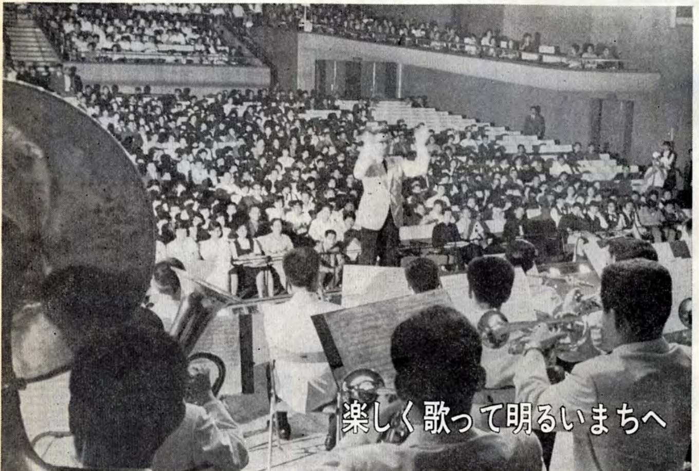
楽しく歌って明るいまちへ

NHKではテレビ、ラジオで市政のお知らせなどを放送しています。 □テレビ ▷毎週火曜午前6.45~7.00「県民の窓」▷毎週土曜午前6.45~7.00「時の話題」 □ラジオ第1 ▷毎朝(日曜を除く)7.15~45「県民の時間」 毎月最終土曜は市長が出席します。