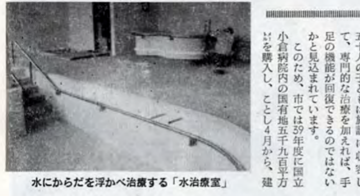
水にからだを浮かべ治療する「水治療室」

現在市内には、十八歳未満のし 体不自由児が約二百人いると推 定されています。このうち約三百 五十人の子どもの施設に収容し て、専門的な治療を加えれば、手 足の機能が回復できるのではない かと見込まれています。 このため、市では39年度に国立 小倉病院内の国有地五千九百平方 メートルを購入し、ことし4月から、建 築費、医療訓練器機など合計す ると約九千八百万円かかりました