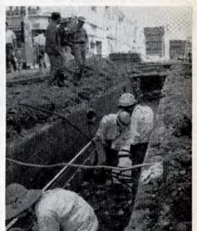
ただいま下水道工事中 区内の沖台、浅生、沢見、中原地区で行なっています。市街地の雨水や家庭汚水、事業汚水を排除して、将来は水洗便所の理想的な市街地をつくる基礎となるもので、完成は来年3月末です。(写真=古池町で)

ツベルクリン反応とBCG接種を戸畑保健所で午前9時30分〜11時に。▽ツ反応注射 10月18日 ▽ツ反定とBCG接種 10月20日