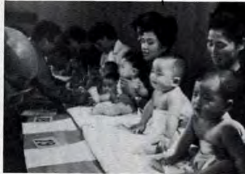
まるまる太って 元気な 赤ちゃん