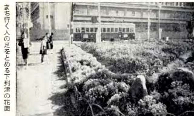
まち行く人の足をとめる下津の花壇

花園コンクール 花いっぱい咲かせて明るいまちづくり。第三回花園コンクールは二百六十二団体のご応募があり、門司区寺内下町町内会と小倉区下津四丁目町内会の花壇が金賞に決まりました。たほか二十九団体が入賞しました。 審査の方法は、①地区の協力体制三十点、②花園の位置など環境三十点、③手入れなど管理二十点、④美観二十点を基準に、婦人会、毎日新聞社、ライオンズクラブの代表と市の二名、計五名で審査しました。門司区寺内下町町内会は萩ヶ丘校区の有料道路の山手にあり、神