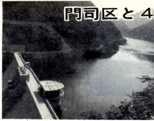
八木山ダムからの導水工事は40年度中に完成します

水道局が充足し、厚生省から「一日も早く門司区の水道施設とつなぐ、水道料金に差をなくすよう」との強い要望がありました。 本市の水事情について、本紙11月15日号でもお知らせしましたが、門司区の恵まれない水事情を解決す