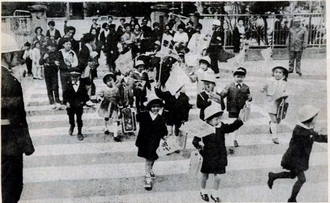
↑ 若松小学校正門前で