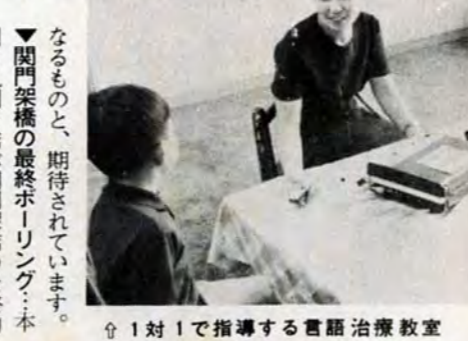
1対1で指導する言語治療教室

▼清水小に言語治療教室 校に9月18日から言語治療教室(写真右)を開設しました。この教室は、口が裂けたため発音がうまくいかない子どもたち(市内には八十八人いる)を治療するもので、県下では初めての試みで、小学校から選考された言語障害児十二人が通っています。治療にはテープレコーダーや訓練電話などを使い、子どもと先生が1対1で一人当り一時間、週一回みっちり指導にあたりたい一年ぐらいて普通の子どもと同じ発音ができるようになる予定です。