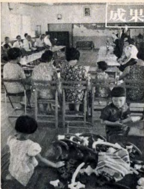
門司幼稚園の開級式で

精養園の教育施設は、重度精養園施設知能指数45以下、ひまわり学級、養護学校など)小中学校特殊学級(知能指数45～70程度)などがあります。しかしこれに入る前の二歳から六歳までの幼児は、これまで教育を受ける機会に恵まれず、家庭ではとく過保護であったり、放任されがら