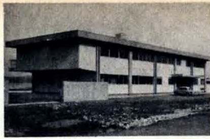
新しくできたモダンな清掃事務所

清掃作業の能率は、まず、衛生的な明るい、作業環境からと、清掃事務局が大里根二理立地先に建設をすすめていた、門司清掃事