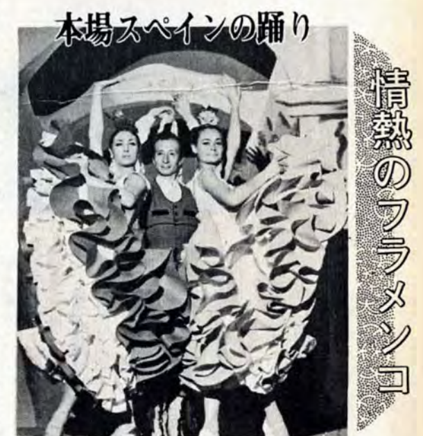
情熱のフラメンコ = ルイシジョ舞踊団 =

●12月3日(日)夜6時半開演 八幡市民会館 優れた芸術を安値で見せる、をねらいに、市では毎年自主公演を行なっています。ことしは情熱の国スペインから来日のルイシジョ舞踊団をご観にいたします。同舞踊団(一行42人)は、昨年ローマ法王主催の職業舞踊団のグランプリを受賞したほか、各地コンテストで無数の賞を獲得している世界最高の舞踊団です。10月30日東京公演を皮切りに、全国35都市を巡回しているもので各地で絶賛を拍しています。プログラムは第一部がリムスキー・コルサコフ作の「スペイン奇想曲」。スペイン特有の楽器を使いスペインの土と香りと血肉を生き生きと感じさせる舞台、ついでルイシジョと美人スター、コンチータ・アントンの二人が息の合ったフラメンコの踊りで「お前と私」。伴奏のフラメンコギターが満喫できることでしょう。さらに「ボレロ」は、有名なラベルのボレロを振付けたもので、全メンバーの花やかなステージです。第二部は「ガリシアの幻想」一ガリシア地方のある町は、若者と娘たちが繰り広げる地方色豊かなミュージカル。フィナーレは強烈なカスターネットの音の響き「ロシアのフラメンコ」。ジブシーの山猫、の異名をもつソラデ・ヘレスを中心にした本場スペインのジブシーフラメンコの多彩な踊りが繰り広げられます。【入場料】S券 1,500円、A券 1,200円、B券 1,000円、C券 600円(百貨店プレイガイド、楽器店などで発売中)