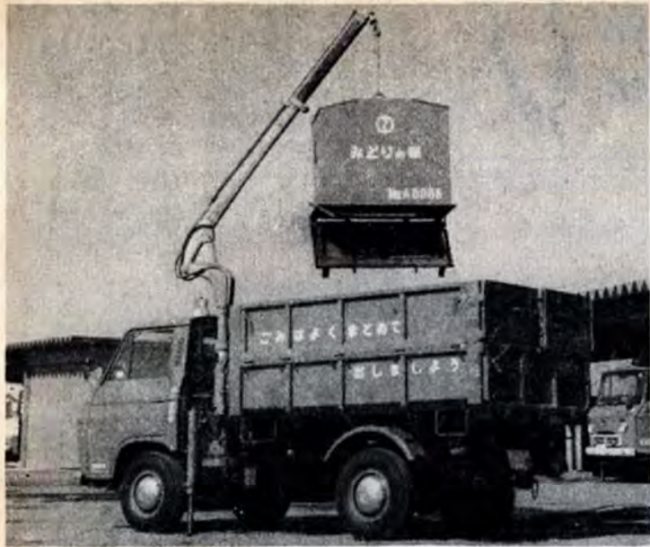
収集車のクレーンでボックスを釣上げ、荷台の真上で箱の底をはずし、ゴミを積む(写真は府中市で使われているダストボックス)

といたことから、このボックス方式を採用したものです。(都合のよいときにゴミが持ち出せる)