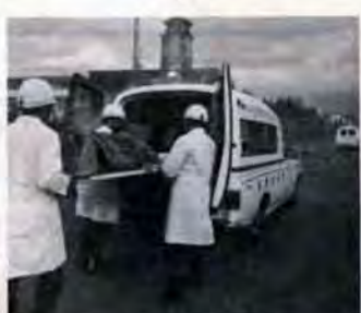
6日の出初め式で市民に顔見せ

新式救急車を二台購入 市消防局では、このほど最新型の救急車を二台購入しました。これまでの出動経験を生かして大幅に改良を加え、床が従来のものより十センチ低く、安定性がよく、患者も一度に二人(従来は一人)収容することが出来ます。また、最近の大型化する事故に備えて、十トンまで揚げる油圧救助器具を備えました。消防署のしごと