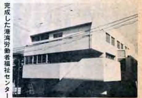
完成した港湾労働者福祉センター

本町二丁目(南海岸通り)に、このほど船員のサービスマンターと、港湾労働者の福祉センターの二つがそろって完成しました。 洞海湾は年々入港船がふえていますが、今までは入港船の乗組員が上陸しても休憩や観光案内する施設がなく、また港湾労働者の作業が深夜に終わった場合、宿泊所がありませんでした。これで洞海湾も働きやすい港になるでしょう。