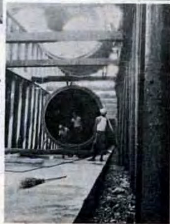
直径2.7mの管が市街地とここを結ぶ

戦後二十四年—わたしたちの生活は、いわゆる「豊かな暮らし」の時代を迎えたとはいわれています。しかしいったん、足もとの生活環境に目を向けると、そこにはおおよそ快適とは、ほど遠い悪現象がじわじわと現われています。とくに都市の行きすぎた過密と基盤整備の遅れが、都市生活の魅力を失なわせます。なかでも都市の汚水問題