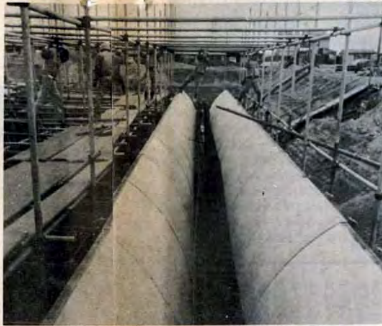
コンクリート流し込む木枠のカーブが美しい。【ばき槽=バクテリアと気的作用で、汚水を水分と汚泥に分離する】

は、近代的なビルとドブが背中合わせ…といった状態です。とかくその対策がおろそかにされてきました。本市では、その解決策である下水道の整備を、42年度から五年計画ですすめています。ここ日明処理場は、最終目標一日五十二万人分の下水を処理するマンモス施設になります。来年春にはまず手はじめに戸畑六万人分の処理を開始します。