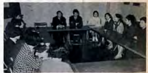
おめでとうノ「ハイ、これからもガンバります」と、希望に燃える若人たち

2月16日午前9時、小倉市民会館前を出発、紫川べりを通り鷲峯山頂の平和観音まで約七キロメートルのコースです。お子さんも、おとしよりも参加自由。当日、市民会館前へお集りください。