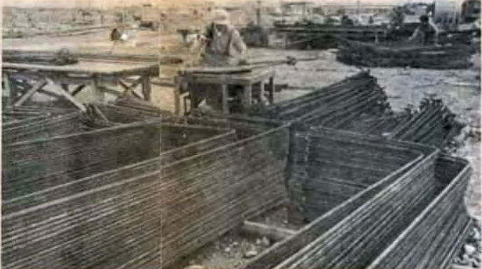
43年度中の事で、鉄筋1,450トン、コンクリートはミキサ・車に6,000台分などが使われます。