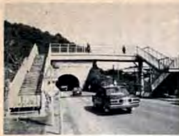
▲199号線に取り付けられた歩道橋

昨年12月に三号線側が完成したのにつづいて、このほど一九九号線側の歩道橋が市建設局の手で取り付けられました。工費は約七百万円。二つの歩道橋の完成で、児童の通学はひと安心です。このほか、穴生中学校前の歩道橋は現在仕上げもすすんで間もなく完成する予定です。