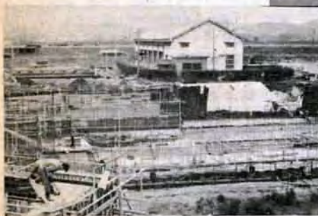
拡張工事がすすむ取水場（写真左）と改修中の取水せき（写真上）