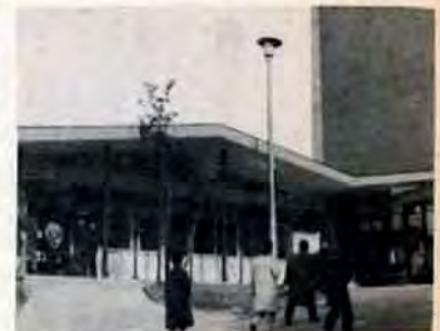
▲明るく広くなった市民相談室

市政に対する苦情や要望をはじめ、市営住宅の申込み、中小企業者の融資の相談など、あるいはこんな問題はどこに相談したらよいかなど、よろず相談にお気軽に利用ください。