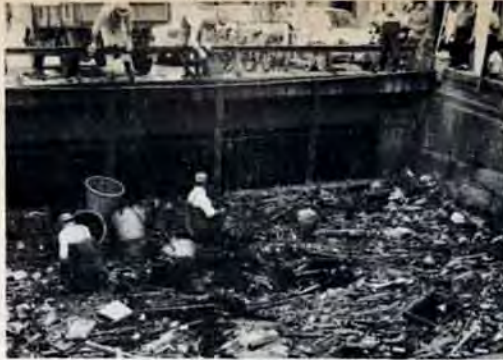
堀川を清掃する人びと

ゴミと臭気の堀川を、自分たちの手できれいにしよう、折尾東・西、長崎の三自治会、町内会、婦人会、消防団、商店連盟、料飲店組合などの人々が、6月22日、クワやカマ、竹ザオなどを手に清掃作業をしました。ゴミがつかえて流れなかった川も、みんなの汗とあふらと熱意には勝てなく、清掃後は、みるみるうちに流れは早くなりました。また、蚊のすみかである草も刈りとりました。作業のあと、参加者が「堀川を守る会」を結成し、以後2回の清掃を決めました。川だけではなく、沿岸の土手、道路もきれいに花壇を設け、美しい街、住みよい街にしていくことになりました。