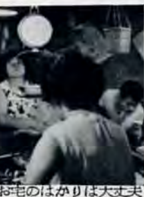
お宅のはかりは大丈夫ですか?

営業用のはかり類は、毎年1回検査を受けなければなりません。都合で検査期間中に受けることができない人は、事前に市計量検査所(戸畑区沢見2丁目5番1号@6989)へご連絡を。手数料は米屋さんの台ばかりで百キロ以下は70円です。検査の日程はつぎのとおりです。