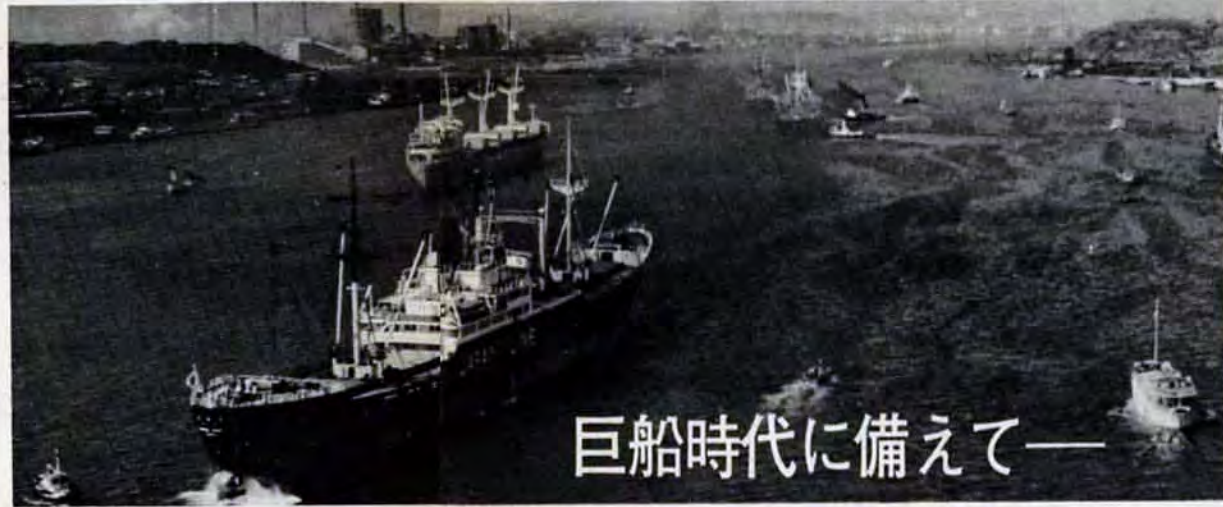
巨船時代に備えて—

港を開いて80年。北九港（門司港区）が貿易港として第一歩をふみだしてから、ことしで80年にかます。いまでは横浜港、神戸港と肩を並べ西日本の代表的な国際貿易港発展しました。しかし大型船やコンテナ船の出現で港も新しい時代を迎え、いま大きく変わろうとしています。