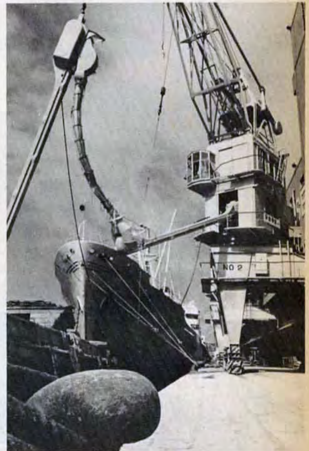
船と倉庫をパイプで結ぶ近代的な荷役（門司港新浜埠頭で）