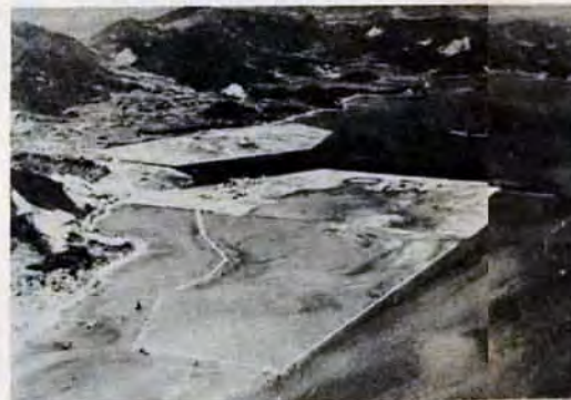
→小倉・日明港。昨年、一万五千級岸壁三バースが完成、引続き五年計画で二万五千級岸壁二バースを建設しています。