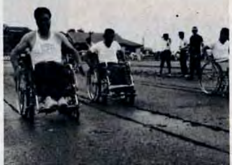
5つの国内記録うまれる

市には、このほか被害者救済のために、一日一円の掛金で最高五十万円の見舞金がでる市民互助の共済制度「北九州市民交通災害共済制度」があります。6月25日現在十二万八千八人の人が加入されており、これまでに二百九十七件の事故に対し九百七十八万円の見舞金が支払われました。また、7月1日から中間市、遠賀郡水巻町が新しく加入区域に入り、募集をはじめました。お宅でもまだ加入していない人は、すぐ勧誘責任者(町内会長、婦人会長さんなど)にお申し込みください。