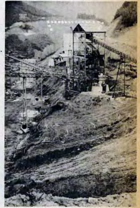
油木ダムの建設現場