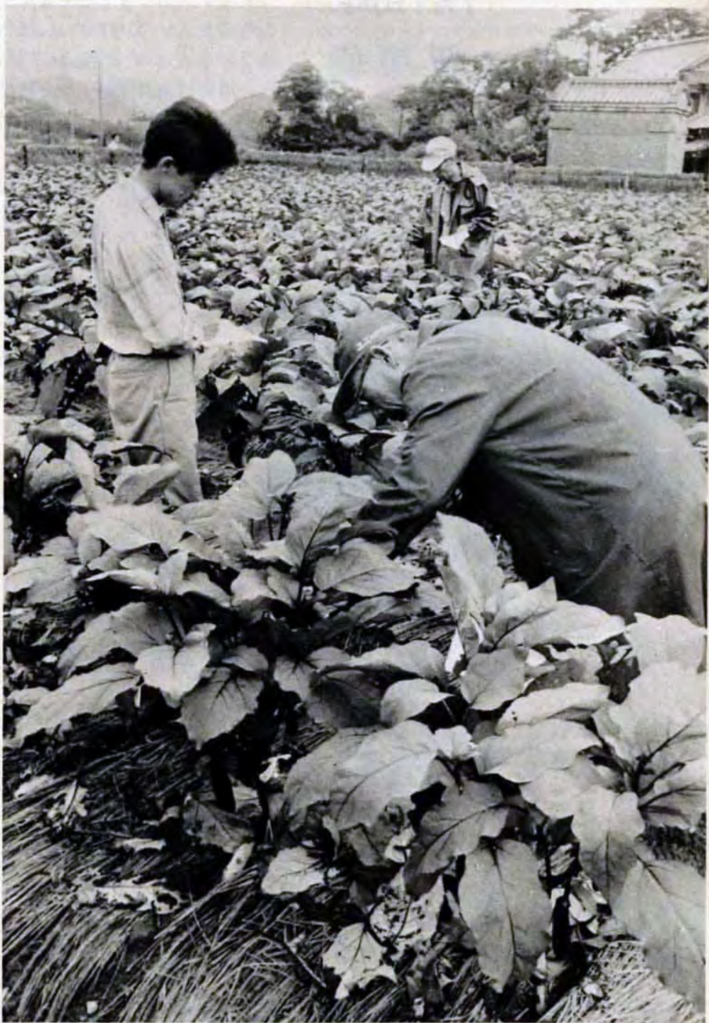
病気はないか、育ちぐあいはどうか—じっくりとみる審査員 (小倉区東谷母原で)

百万市民の台所へ新鮮で、良質な野菜をとどけるため市では、ナス、キュウリ、トマトなどの品質向上や生産技術の改善をはかる「夏野菜立毛品評会」を行なっています。市内で作られる農産物の自給程度は野菜で三〇%ほどですが、ナスなどの大衆野菜は最盛期になると、市内需要の半分以上をまかさないです。