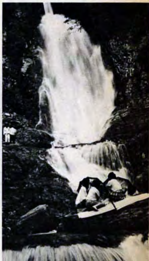
落差30メートル、市内最大の菅生の滝。道原から約2キロは歩いて40分。途中の溪流ぞいの道は、家族づれのたのしい散歩道。

●八幡旗山キャンプセンター…八幡区帆柱山頂。青少年の野外訓練が目的で約百二十人収容。水道、便所なども完備。利用申込みとテントなどの貸出しは、八幡区役所内教育事務所係へ。 ●八幡旗山キャンプ場…帆柱山キャンプセンターのすぐ近くの一般キャンプ場。約百人が利用でき、水道、便所もあるが、貸出し用具はない。利用申込みは八幡区役所内建設事務所係へ。 ●門司中央公民館…小倉江電停から40分の矢筈山頂。青少年用だが一般も利用できる。約二百人収容で井戸、便所も完備している。利用申込みと用具の貸出しは、門司中央公民館へ。 ●小倉足立キャンプサイト…青少年の合宿、研修施設。青少年の家(六十人)の敷地内で、約七十人収容。水は青少年の家のを利用する。申込みと用具貸出しは、小倉中央公民館へ。隣接する森林公園一帯は、一般にも開放しているが水の便はない。申込みは小倉区役所内建設事務所係へ。 ●若松有毛キャンプ場…青少年野外訓練用で、約六十人収容。井戸、便所もある。利用申込みと用具貸出しは若松中央公民館へ。 ●戸畑金比羅公園キャンプ場…青少年用だがあいていれば一般も利用できる。約六十人収容で、水が公民館へ、月々貸出しはすべて全部予約済み。