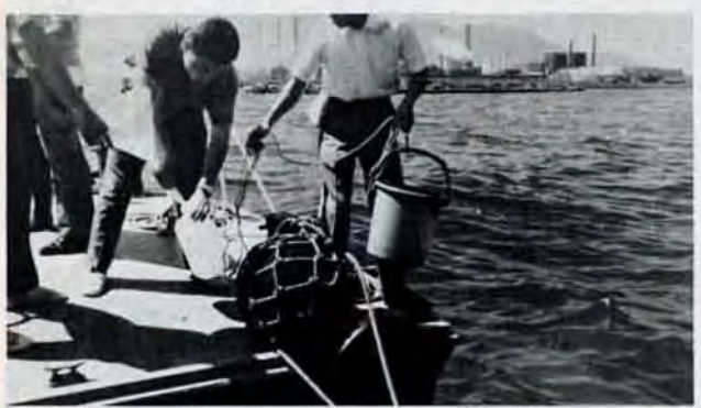
死の海から採水 本調査始まる 大腸菌も住まない死の海、洞海湾の水質基準本調査が行なわれています。調査は、経済企画庁が湾周辺工場の排水を対象にするという、県と市は、これに関連して、湾内の海水、河口の水、海底の沈んでん物を対象に行なっています。調査の結果、早ければ本年度中に、法による水質基準が定められます。

工場は事前に準備 注目される新しい対策として、知事の権限であるスモッグ「警報」の前に、「注意報」が市長の権限で発令できることに裏付けができたことです。 注意報によって対象工場(重油を多量に使用するもの)に