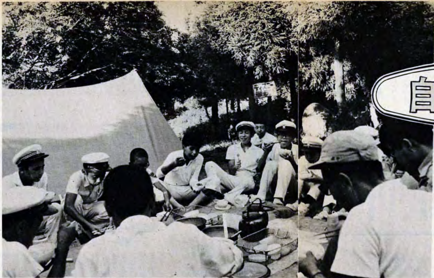
青少年グループでにぎわう帆柱キャンプセンター。付近には国民宿舎や遊園地もあり10のピクニックには最適です

▶屋外のそうじ…ミゾをさらえて流れをよくする。水たまりをなくし、雑草を刈る。※もえるゴミはできるだけ町内で焼き、ミゾさらえの汚泥は1か所にまとめてください。ゴミ処理は一般の定時収集を強化して行ないませんが、汚泥処理には別に車両を配置しますので、できるだけ町内でまとめて清掃事務所へご連絡を。