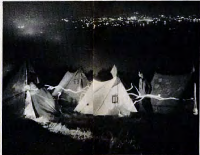
関門の夜景がすばい矢筈山キャンプサイト