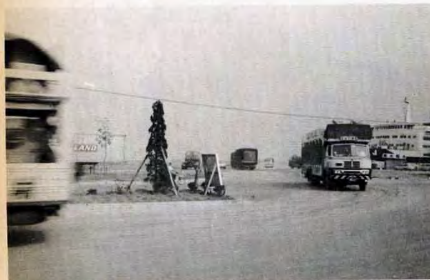
幅広いメイン道路が心臓部を貫き、フェリーが東は阪神地域、南は九州南端を結ぶ(日明)

働きよいまち 住みよいまち 今後市では、この三つの臨海工業用地の有利性をさらに生かした市内の経済発展を促進しなければなりません。そのためには響灘、新門司さらに広く周防灘の臨海工業用地の造成計画をすすめるとともに航路、泊地を整備して船の大聖化にそなえ、遠賀川河口ゼキなど工業用水の確保につとめていくことにしています。 だが一方では市民の生活環境面の整備もおろそかにできません。本市を働きやすく住みよいまちにするためには住宅・下水道・道路・公園・学校などの都市的機能を充実させ、福祉面にもいっその力をいれていきます。問題の公害についても進出企業と市の間で公害防止協定を結ぶなど、明るいまちづくりの努力していきます。