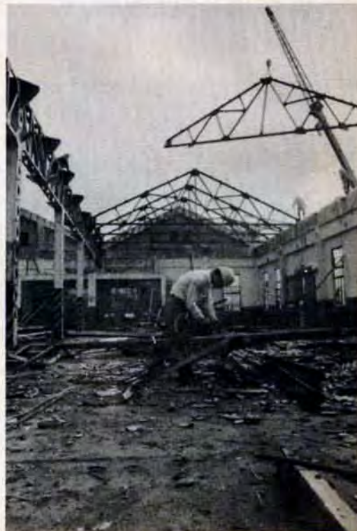
取りこわし中の造兵廠跡

小倉区日明に国鉄のコンテナ専用貨物駅「浜小倉駅」が誕生。10月1日から貨物の取り扱いを始めています。流通センターをめざす日明埋立地と結び、北九州のコンテナ貨物全部をここに統合、貨物輸送の新しい基地となります。