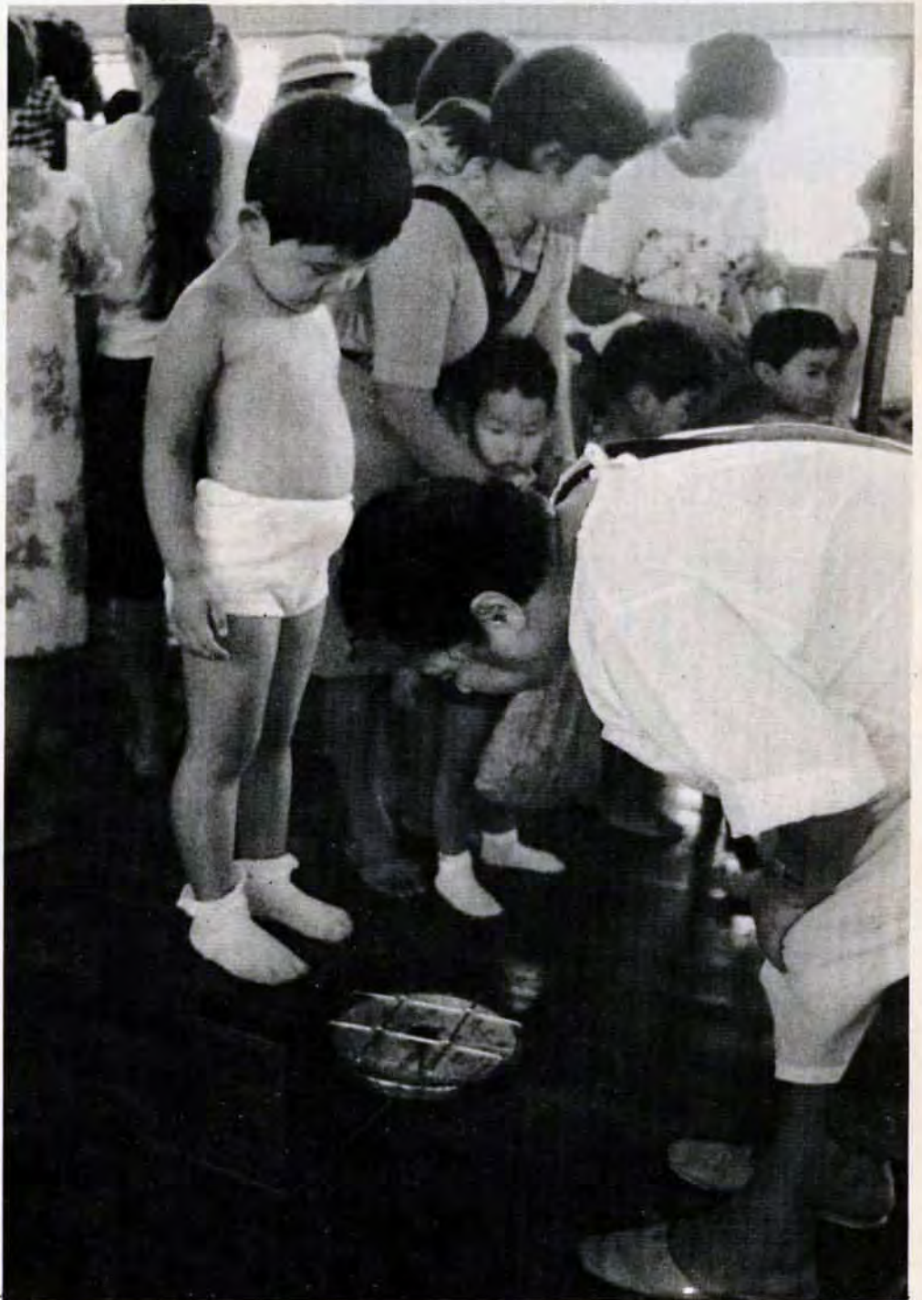
若松区二島小学校で