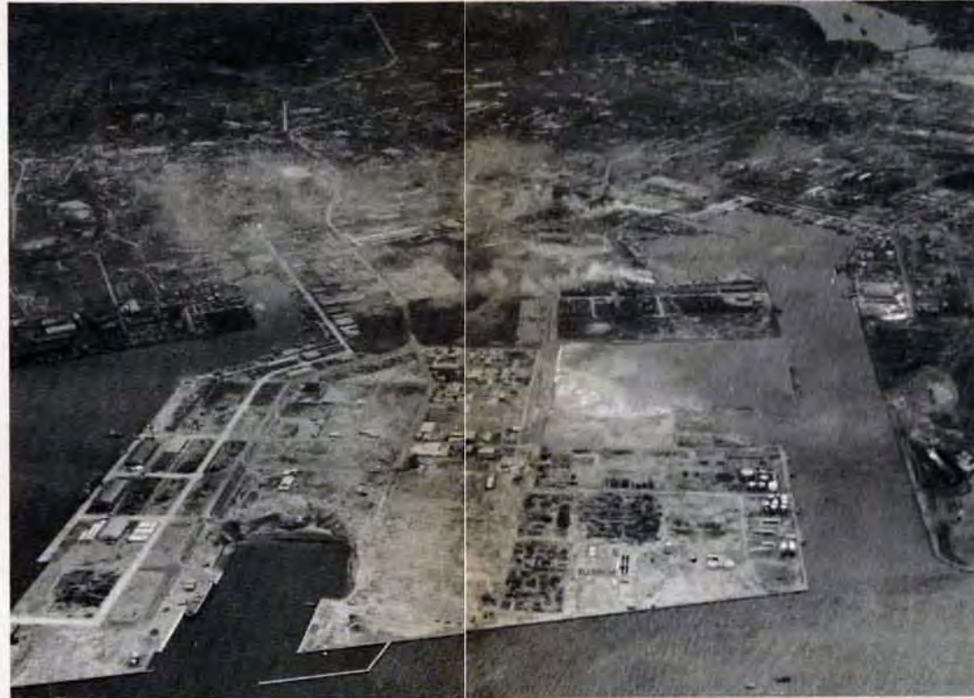
小倉の中心から車で7分程度、周囲約7キロのおよぶ流通センターの日明埋立地は、ほぼ100%完成