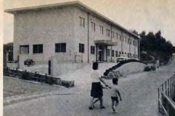
新児童相談所の全景

▽小中学校の整備に五千三百万円と債務負担九千八百万円。第二南小倉小、第二引野小、第二企救中の新築。広徳、陣山両小の増築や特別修繕、プール用地の買収など。 このほか目新しいものとして、 ▽消防艇購入に三千三百万円▽危険な野つば対策に百五十万円▽公害調査費に三百万円▽学童ぜんそく疾患調査費に百五十万円▽油症患者生活資金貸付金に二百五十万円▽貿易振興資金融資預託金の追加一千万円など。 また特別会計では新しく、寡婦福祉資金貸付費三百六十万円と、道路用地などを先行取得するための土地取得費一億五千万円の各会計が新設されています。