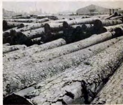
輸入木材の激増にそなえ48年完成目標の響灘貯木センターづくりを急いでいます