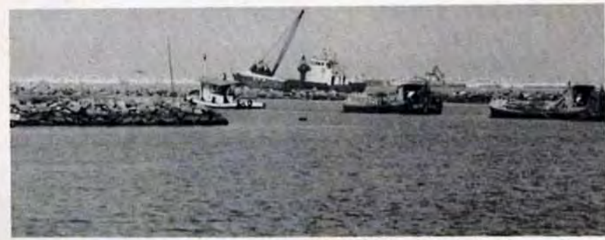
大陸、東南アジアを控え優れた条件をもつ響灘埋立計画は戸畑区の2倍以上の面積