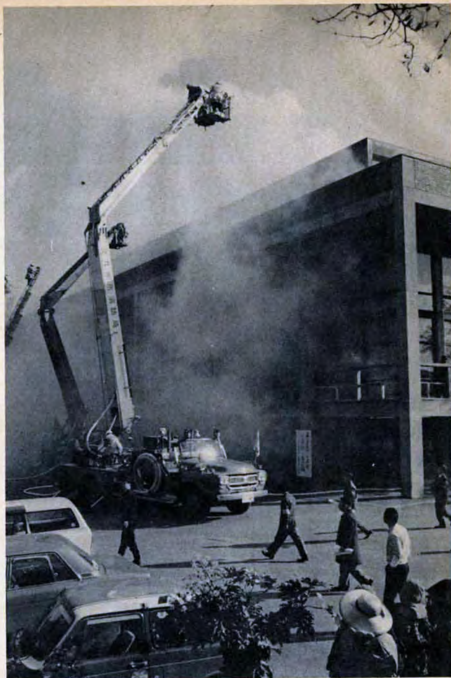
小倉市民会館からの出火を想定した消防総合演習。万一に備えて厳しい訓練が続けています。(12月4日、小倉市民会館前で)