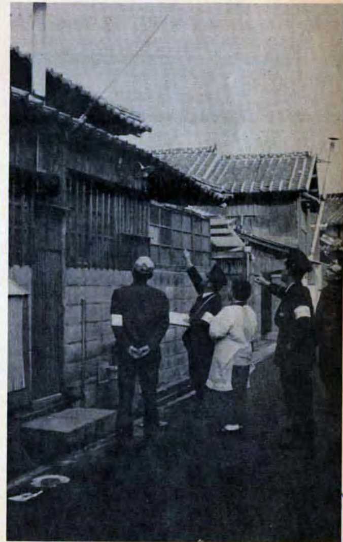
お宅の煙突は大丈夫?—火事になる原因を事前に見つけ、改善指導するのは予防活動の重要な仕事。(門司区内で)