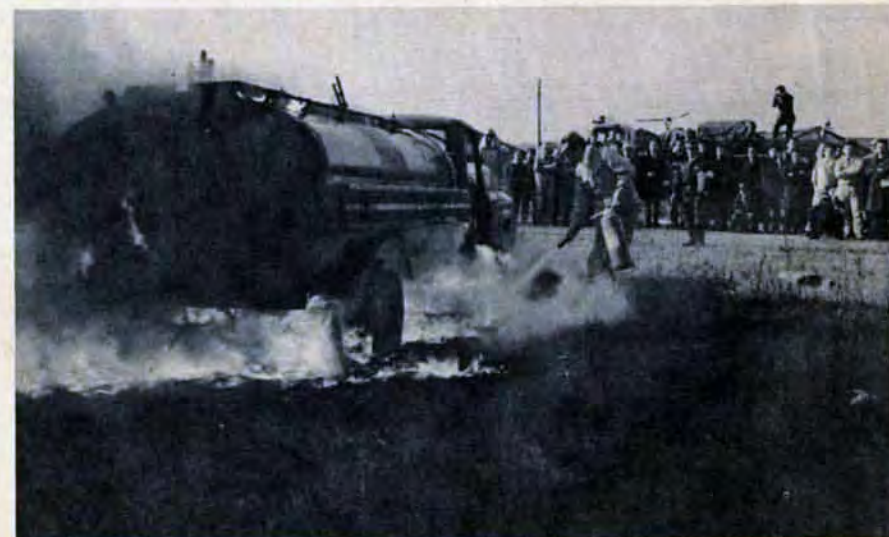
石油火災はこうして消火——と石油を扱う会社、工場を対象に消火訓練。