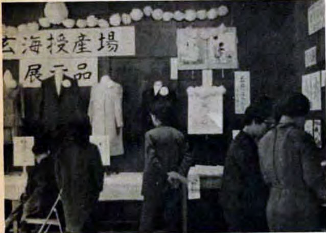
海産物市場 展示品

市内の身体障害者のみなさんの文化祭が、12月1日戸畑文化ホールで開かれました。当日は弁論や手話、歌などの競技会や、作品の展示会を通じて、うるおいのある生活や文化向上をめざす楽しい一日をすごしました。