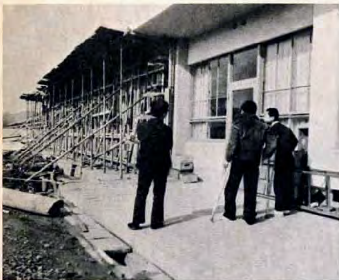
通園施設の新築とあわせて、同園の児童が勉強する教室の増築も急ピッチ