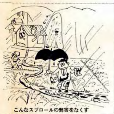
こんなスプロールの弊害をなくす