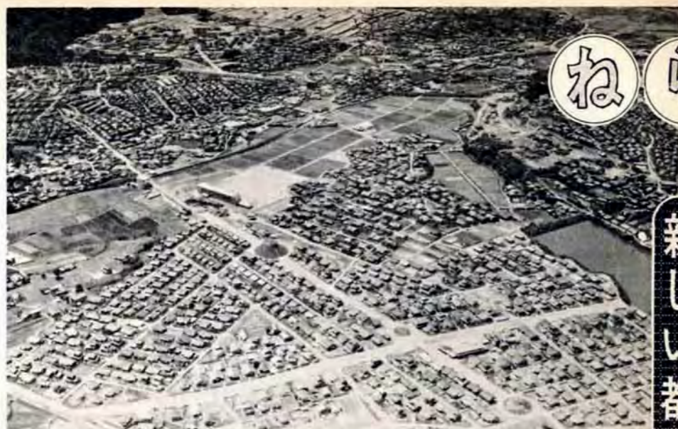
計画的にまちづくりが進められている地域

■消火器は検定品を 家庭用消火器の検定制度が施行され、1月1日から検定合格証のないものは販売できなくなりました。消火器をお求めの際は、検定マークを確かめてください。すでに購入済みの未検定品は、消火効力などを消防署で検査してもらいましょう。