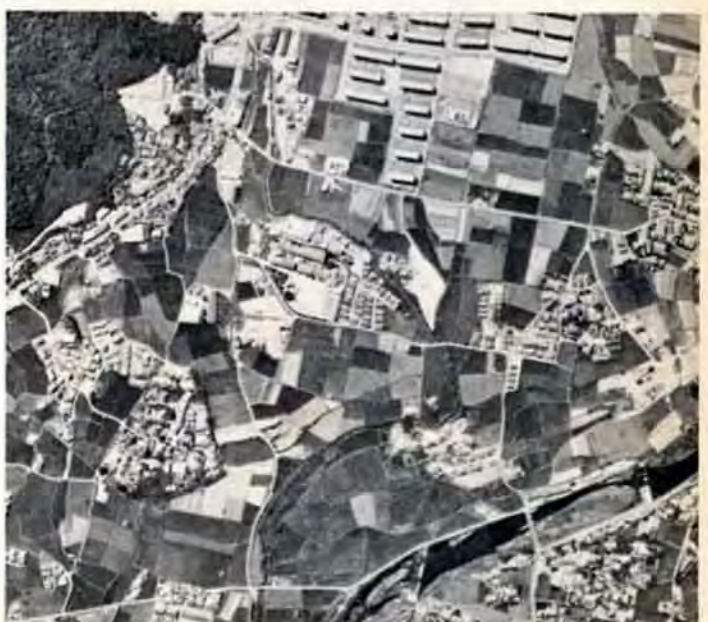
田畑が虫くいのように宅地化されている地域

議会議員、市町村議会の議長の前で表者で構成)に提出し、都市計画として決めることを相談します。⑤建設大臣の認可 県知事は、区域区分の都市計画を決める前に、建設大臣に案を認めらわなければなりません。都市計画は、国の政策にも多くの関連を持っていますので、建設大臣は、農林・通産・運輸などの各大臣と十分に協議し、意見を聞いたうえで認可します。以上の手続きがすべて終わり、はじめて県知事が都市計画を正式に決定します。区域区分の図面や書類は、市にも送られ、一定の場所で見ることができるようになります。