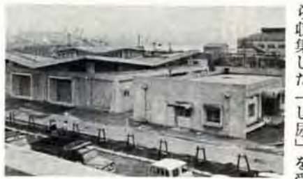
し尿圧送所が完成

海洋投棄をへらす し尿圧送所が完成 し尿圧送所（小倉区西港）は、小倉、戸畑両区と門司区の一部から収集したし尿を受け入れ、日明下水処理場へ三キロメートルの圧送管で送る施設。し尿の海洋投棄をへらす役目をもっています。総工費は二億六千万円。現在、市内全体のし尿収集量は一日約千五百キロ。そのうち半分にあたる七百七十キロを海へ捨てて処理しています。同圧送所の完成で、この海洋投棄が百キロ減ることに