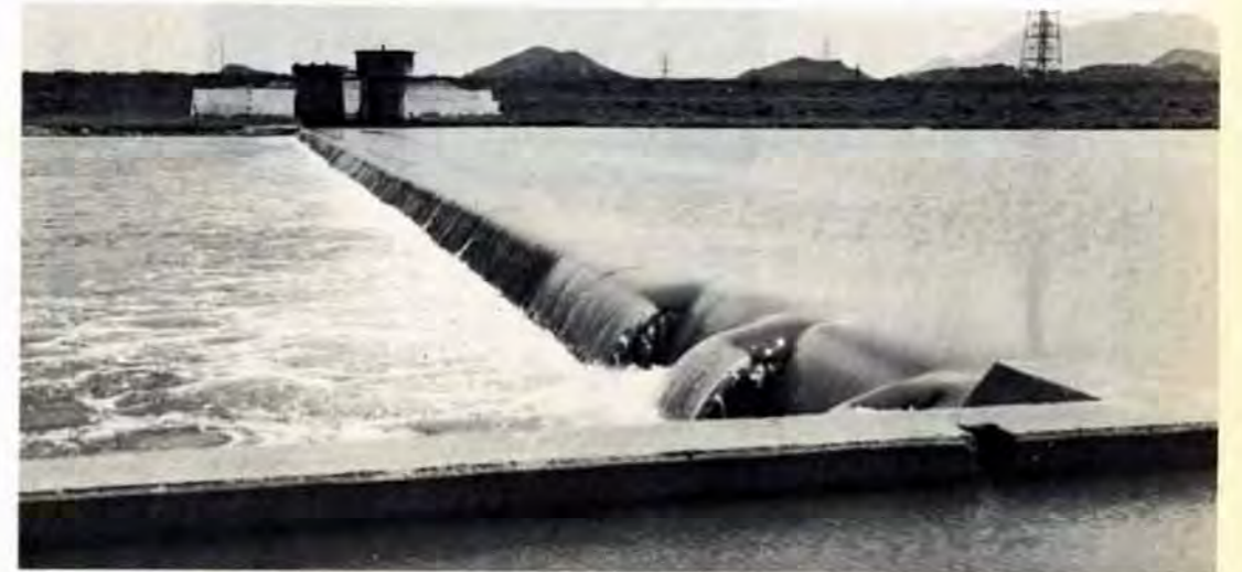
伊佐座取水場 市内の水道の源は大きく分けて遠賀川水系と紫川水系に分けられ、その80%は遠賀川水系に頼っています。そこで活躍しているのがこの取水場で、昨年夏の増強工事によって、取水能力は5割アップし、水利権いっぱい52万トになりました。