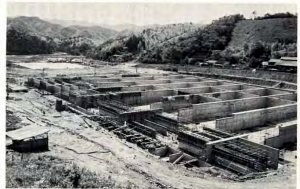
井手浦浄水場 三期拡張事業の一つで、平尾台山麓で楯音を響かせています。現在工事は、約三割進んでおり48年に完成すれば油木・ます沢ダムの水を一日二十万ト浄化します。