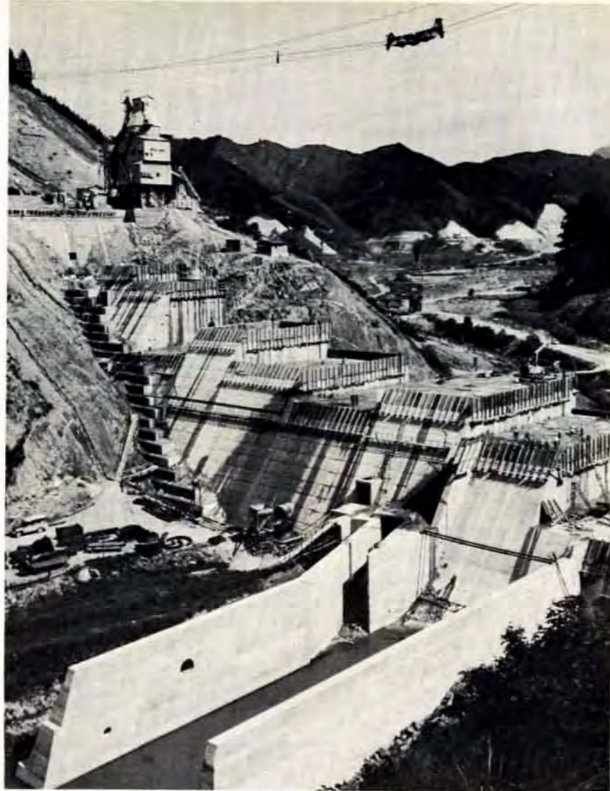
油木ダム 県と市の共同事業で46年春完成を目標に建設が進んでいます。市の負担は20億円で総貯水量1,745万トンの1日最大10万6千トンの水が本市に送水されます。ます沢ダム（1,300万トン）の建設は、ことし中に着工し、48年には完成する見通しです。

甲種と乙種の試験を7月12日午前10時から北九州大学（小倉区北方）で行ないます。また、このための準備講習会を6月24日（1、2、3類）、25日（5、6類）、26日（4、7類）小倉労働会館で行ないます。申込は、いずれも6月23日までに市消防局（小倉区江南町4-16、93局0400）へ。