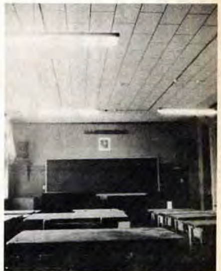
明るさもひとときわました教室照明

ではなぜ今まで解消できなかったのでしょうか。戦前からの校舎が非常に多く、改築にせまられるいっぽう、児童の増加による校舎の増築や、新興住宅地での新設校の建設など、巨額な費用を必要と