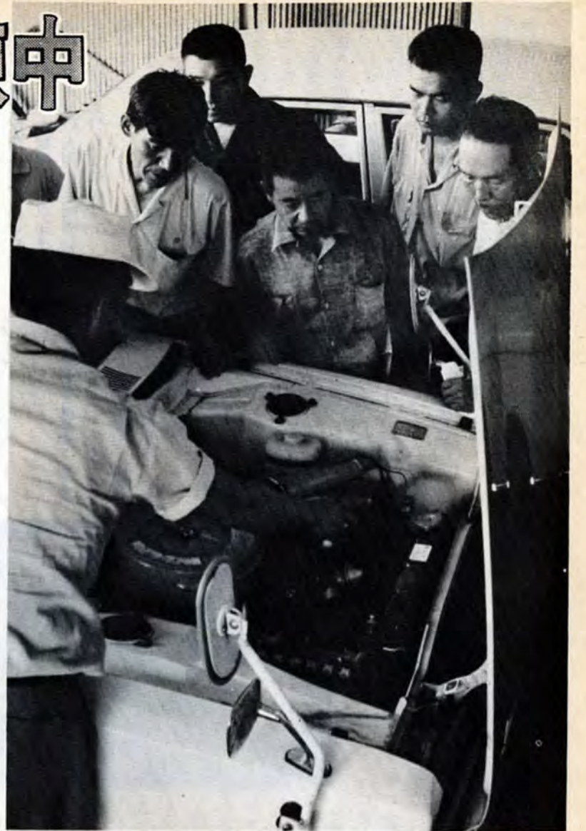
△「キャブレターがつまったらここを…」指導員の指先に真剣な視線が集まる