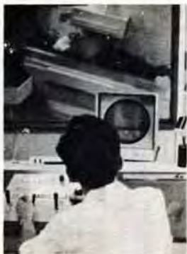
門司病院にX線テレビ

つくりませんか 公園愛護会 公園愛護会をつくるに年四一万円から二万円の助成金を差上げます。同会は小学校区に一団体とし老人会、自治会、婦人会、子ども会などで設立できます。事業内容は児童公園内の除草、清掃、美化保全、禁止行為の報告、遊戯の指導などです。希望団体は8月末日までに、各区建設事務所管理課へお申込みを。