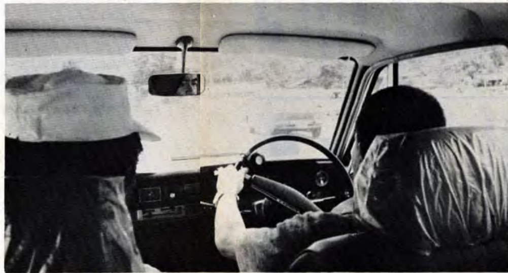
△ヨージ、今日は失敗なくコスを回るぞ、ハンドルを握る手に思わず力が入る