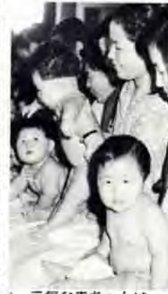
元氣な赤ちゃんはママの喜び

元氣な赤ちゃんを生み育てるには、妊娠中の母親の健康管理が基本になります。そのためには、妊娠中に健康診査と指導を受け、異常の早期発見、早期治療などの適切な処置をとることがたいせつです。 市では、7月から低所得世帯の妊婦を対象に無料健康診査を行なっています。