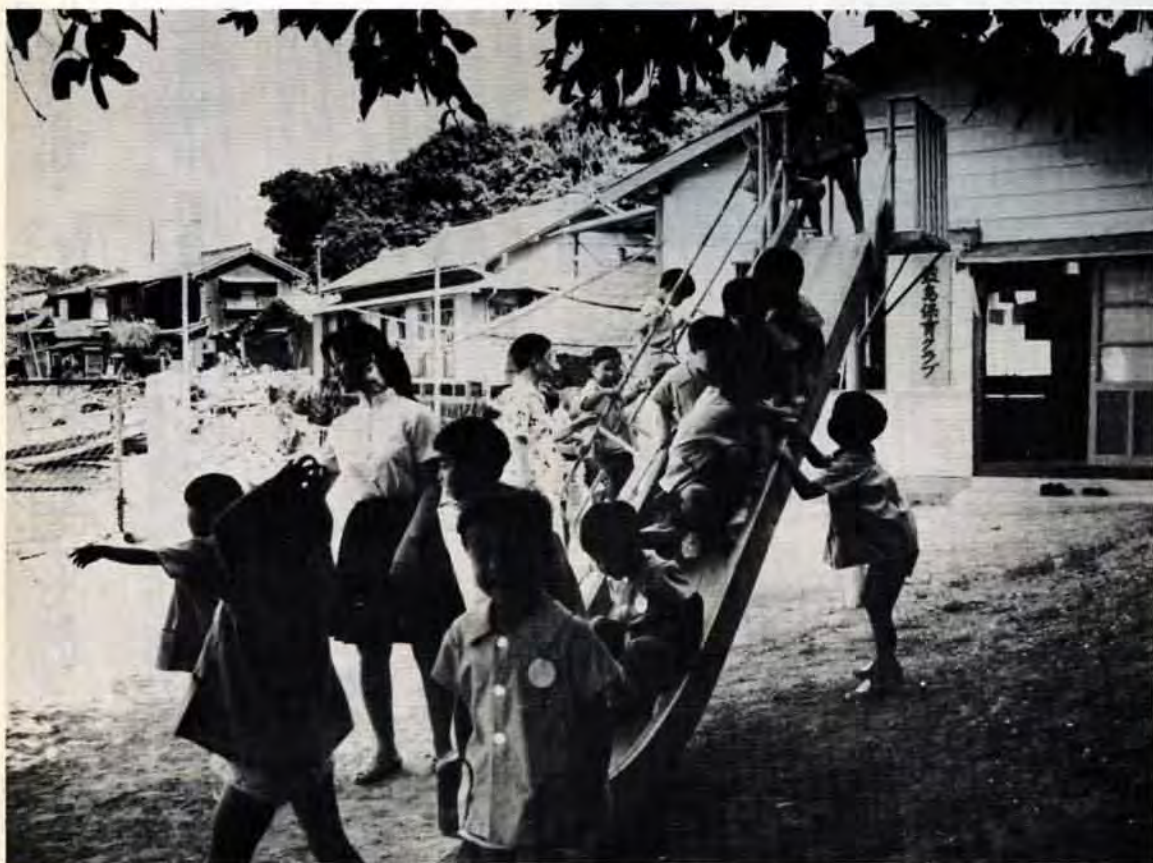
21人のチビっ子は若い朝江先生が大好き