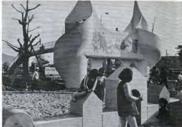
▲新勝山・児童公園 おとぎの国をおもわせる門、大砂場には海の人気もののタコやイルカ、タツノオトシゴ。芝生には、ゾウ、ライオンなどがおり、子どもたちは夢がいっぱいの遊具に大喜び。