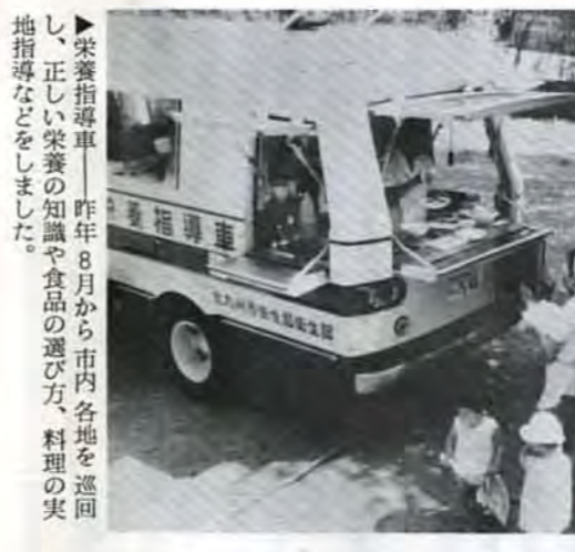
▶栄養指導車 昨年8月から市内各地を巡回し、正しい栄養の知識や食品の選び方、料理の実地指導などをしました。

戸畑駅前建設中の消費生活センターは1月11日に開店します。このセンターは、市民のみならず、かきこい消費者になつていただくために商品の苦情、相談から、繊維製品、家庭電気製品のテストや消費生活一日教室などを実施していきます。