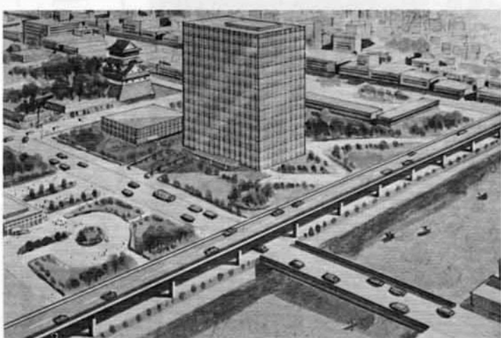
新庁舎周辺と都市高速道路

す。物をつくる意欲もそがれます。施設が少なすぎるのではないかと、いうくらい利用してほしいですね。 新庁舎周辺と都市高速道路