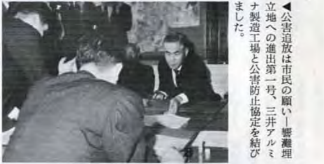
▲公害追放は市民の願い——響灘理立地への進出第一号、三井アルミナ製造工場と公害防止協定を結びました。