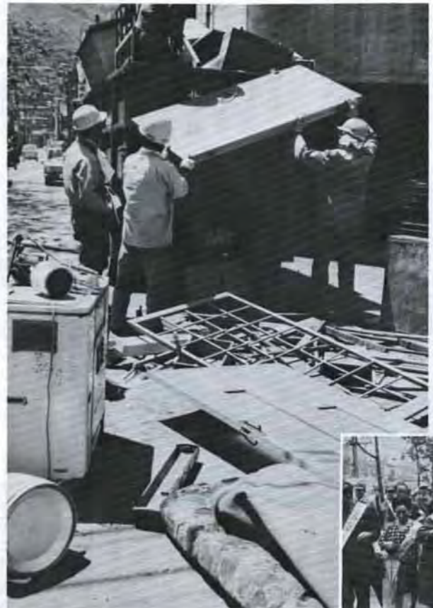
▲市では昨年はじめて、大型ゴミの収集を実施。タンクやテレビなど8,600個、トラックにして約880台もありました。▶市民のみなさんも「まちの美化と交通安全推進会議」を結成し町の美化につとめました。

一九七〇年の北九州市は、財政力も伸びて、本格的な町づくりの年となり市民生活の環境整備に力をそいできました。大気汚染の権限の委譲、同テレメーター中央監視局の設置、公害防止条例、同施行令の実施など、公害追放の年、にふさわしくその対策を一段とつよめました。明るい町づくりのきめ手となる下水道の整備も進め、また、老人性白内障の手術、三歳児健康診査の開業医委託、栄養指導車の購入などで、市民の健康を守るようつとめました。