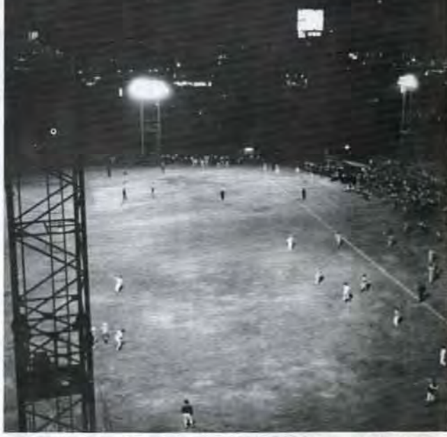
▲夜の余暇をたのしく有効に一動一静青少年のスポーツやレクリエーション活動のために、八幡区の高野台球場、戸畑区の浅生球場など4か所にナイター照明をつけました。