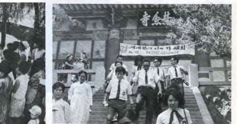
▲204人の若ものをのせた「青年の船」は、韓国、沖縄を親善訪問、集団生活で青年の視野を広げました。