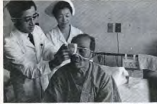
▲いつまでもしあわせに——老人性白内障で目の不自由なおとしよりの開眼手術を実施しました。

一九七〇年の北九州市は、財政力も伸びて、本格的な町づくりの年となり市民生活の環境整備に力をそいできました。大気汚染の権限の委譲、同テレメーター中央監視局の設置、公害防止条例、同施行令の実施など、公害追放の年、にふさわしくその対策を一段とつよめました。明るい町づくりのきめ手となる下水道の整備も進め、また、老人性白内障の手術、三歳児健康診査の開業医委託、栄養指導車の購入などで、市民の健康を守るようつとめました。