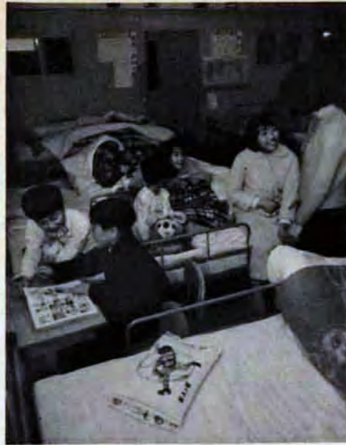
夜は寮母さんが宿舎を巡回します

県では1年間の集団生活で機械、測量の技術を身につけていただくために、46年度産業開発青年隊を募集しています。応募資格は、高校卒業程度の学歴があり、18歳以上25歳未満の未婚の男子で、将来建設事業に従事する人。経費は約10万円。希望者は3月20日までに、福岡県八幡農林事務所農地課(八幡区折尾末里、69局0257)へお申込みください。