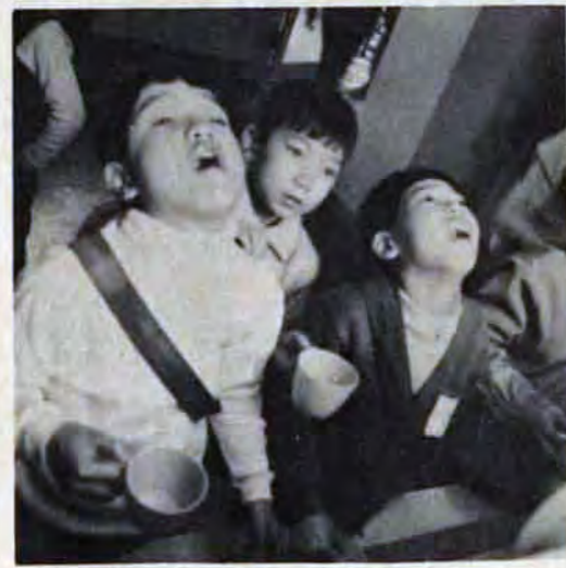
↑一日一回の養護体操 ↑一日七回うがいをします。健康診査は週三回