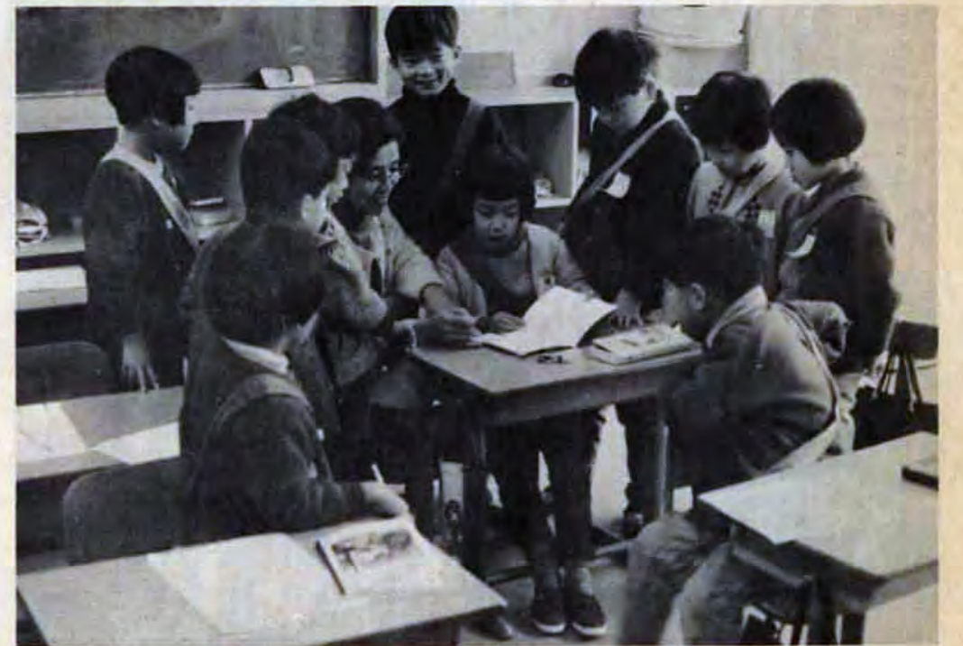
1クラス10人前後。いきとどいた学習指導ができます。タスキは健康状態を表わします

4月から開校する小倉南養護学校(八幡区若園四丁目1-1、福岡教育大学附属小倉中学校跡)児童、生徒を募集します。対象者は、知恵おくれの子どもで、募集人員は小学部一年から中学部三年まで各学年ごとに八人ずつ。募集は2月末日まで、申込は各区教育事務所か教育委員会学事課一八幡駅ビル内、68局4931へ。通学は個人通学です。