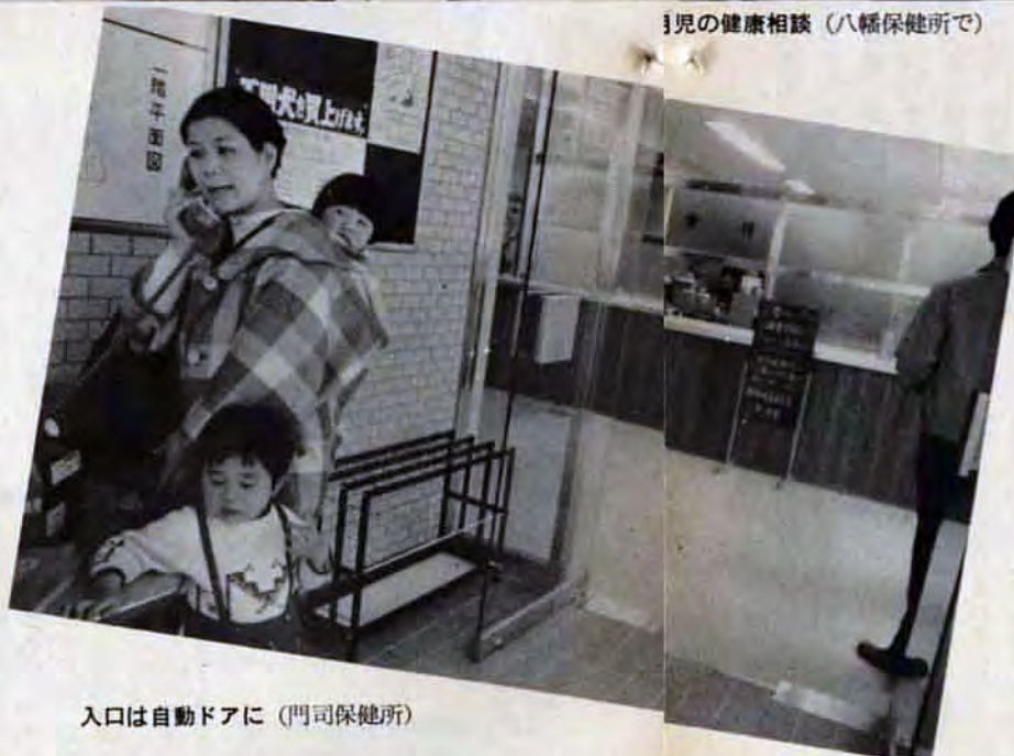
入口は自動ドアに(門司保健所)