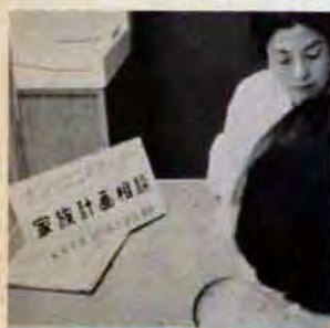
まず家族計画から