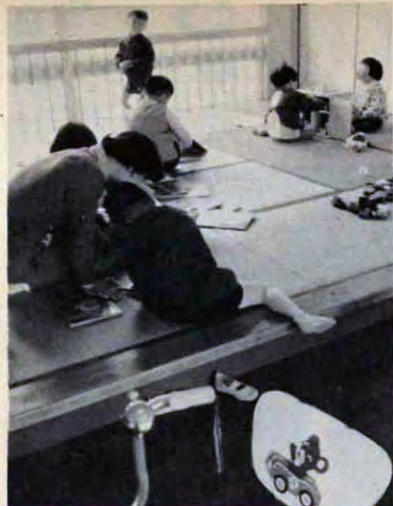
ままごと、積木遊びでグループ生活を身につける

4月17日、戸畑区 境川二丁目、公立 では初めてのちえお くれの子どもの、戸 畑幼稚園が誕生。 就学前の四歳から 六歳までの子どもさ んを対象に、しつけ や身のまわりの処理 や情操を養うために 開設されました。