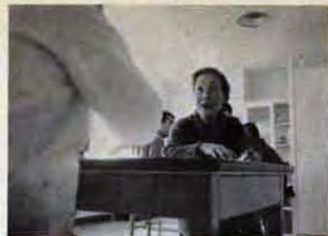
老人の健康相談も(若松保健所)