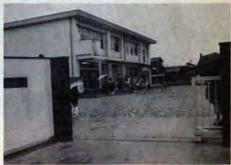
開園したばかりの戸畑幼稚園

初めてです。 先生は、一人一人 の子どもをよく観察 し母親がそばにい なくても、自分一人 で遊べるように興味を もたせ、かくれてい るよい面を引出して いきます。 施設に細かな配慮 そのため、施設、 設備では工夫がされ ています。窓を大きくして採光を よくし、柱や角(かど)は丸味をつ け、建物全体を明るく暖かいもの にしました。とくに、観察室と保 育室は十分気を配っています。 観察室は、マジックミラーを つけ、子どもたちには気づかれず に集団生活の様子や保育中の行動 が観察でき、先生たちが保育する 上で非常に役立ちます。お母さん たちも家庭でどのようにしつけた らよいかこの観察を通して参考に していただきます。いわゆる、同 園の要(かなめ)といえるところ です。