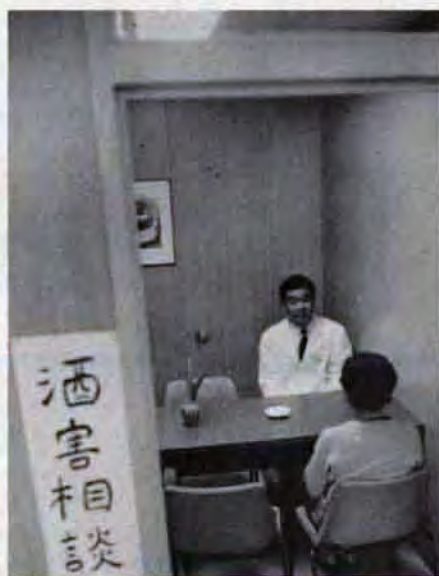
酒害相談—家族の人でも結構(門司保健所)

北九州市立 郷土資料館(小倉城内) 藩政、民俗、美術、考古学など広い分野から貴重な郷土資料五百点を展示しています。 訂正 市政だより4月15日号の五ページ洋式ランプの説明中、「電氣代は二か月の電氣代は十六圓光で四五十圓。当時米一升十二、三圓」にお詫びして訂正します。このことについて、みなさんから電話やお手紙をいただきました。ありがとうございました。