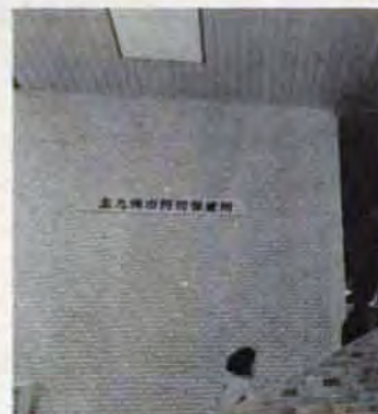
門司保健所—4月新装