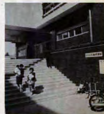
八幡保健所—昨年10月新装