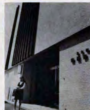
若松保健所—3月新装