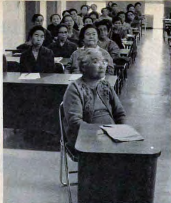
時代に遅れないように...

零歳児の検診も忘れずに 四・七か月児と三歳児の無料検診は、もよりの医院でお受けください。とりわけ三歳児の検診は、お母さんがたがつい忘れがちですが、子どもさんの将来の健康を左右する検診といつても言い過ぎではありません。必ず受診を。身体だけでなく、歯の検診も歯科医院や病院で受けましょう。 の全妊婦を対象に無料健康診査(年二回)を実施します。これは昨年度、低所得世帯の妊婦を対象に行なっていたものを、全妊婦に広げたものです。 健康診査は、妊娠の前期、後期の各一回ずつ二回で、診察、血圧測定、血色素検査、尿化学検査をします。その結果精密検査が必要な人については、検診料を市費で負担します。 受診票は、各保健所で母子健康手帳を交付するときにさしあげます。なお、7月1日以前に母子健康手帳をもらった人は、保健所に手帳をもって申出てください。 診察場所は市内の産婦人科医院や病院など、市に登録されている専門医です(ステッカーを貼っています)。 また、妊娠中毒症や糖尿病で入院治療七日以上の妊婦については療養費(所得税が四千八百円以下の世帯の妊婦)を支給しますので、保健所にお申出ください。