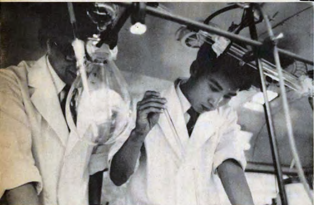
検査は慎重に、そして早く...