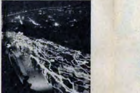
一若松・火まつり行列

助産婦・看護婦 を募集 市病院局では、助産婦、看護婦、准看護婦を若干名募集します。