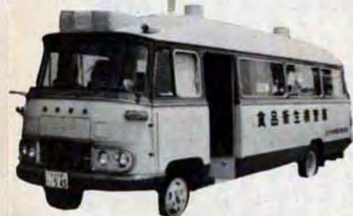
お客さんの少ないときをねらって検査物を収集

アイスクリーム、うどん、かまぼこ一三品目が朝の打合わせで、検査対象に決まった。 食品衛生検査車がスタートします。きようは戸畑駅前が、拠点です。食品衛生監視員は二人一組で、市場やスーパーマーケットに向う。うどん一つでも、製造する店が違うので数軒の店を回らねばならない。検査対象の種類が多ければ多いほど回る店も多くなるので、仕事はなかなかかたからならない。「こんにちは、食品衛生監視員です。食品に添加物が含まれているかどうかを調べたいのですが」「どうぞ」店の主人の心よい応待で仕事もはかどり、昼ごろにはかごの中にはほぼ目的の品が集まった。車に帰り、早速検査にとりかかる。 かまぼこは、ほう酸が使われているかどうかを調べる。ほう酸は法定外殺菌料で、内臓を悪くする。クルクミン試験紙で試験し、赤くなれば違反品だ。このかまぼこは反応なし。うどん類も異常なし。ソフトクリーム類は保健所に持ち帰り、細菌培養。検査の結果二十六件中七件に大腸菌を発見。厳重な行政指導を行なう。 「里いもは漂白してないと買わない、ただ見かけがよければよいなどというのは消費者自身にも考えてもらいたいですね」と監視員の声。 これからは食中毒が起きる季節。添加食品とともに、食品衛生管理が十分に行なわれているかどうか、食品衛生検査車は監視の目を光らしてきようもまちを走ります。