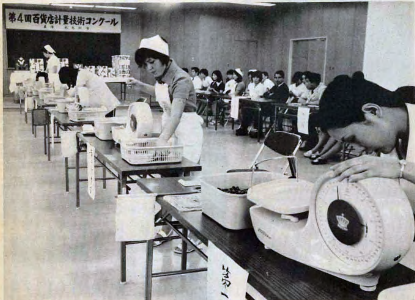
6月18日、消費生活センターで

6月1日現在の人口 ▶ 総数1,042,465人 ▶ 男504,732人 ▶ 女537,733人