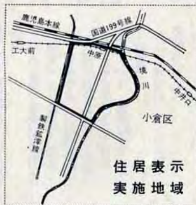
住居表示実施地域

住居番号の設定や名簿の作成のために、9月から12月にかけて世帯主や事業所の名前、住所(所在地)、棟割りなどを、市が委託した専門職員が現地調査に伺う予定です。調査員は身分証明書を持っています。