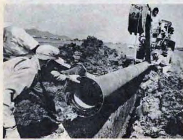
未給水地区をなくす 市内の未給水戸数は約1割。これを解消するため、昭和50年までに15億2千万円をつぎこむ計画で、配水管の新設を急いでいます（写真〇小倉区葛原で）

この取水量で足りない分を貯水でまかなうわけですが、5〜6月の降雨量は三百五十五・六（昨年は五百五十九・六）と極端に少なく、これが影響して取水量、貯水量とも昨年を下回っているのが現状です。