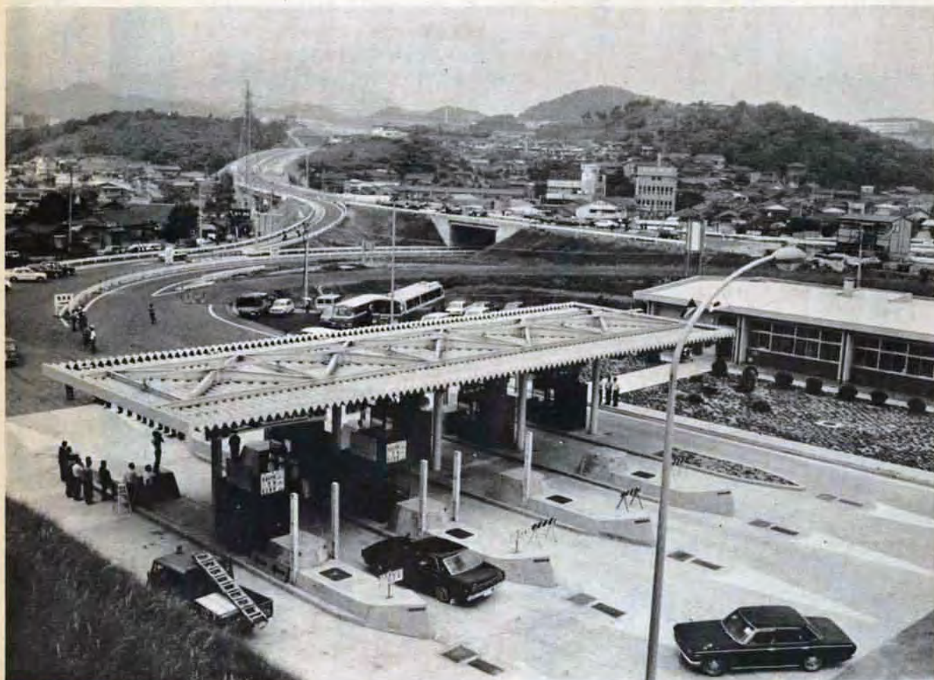
開通した紫川インターチェンジ