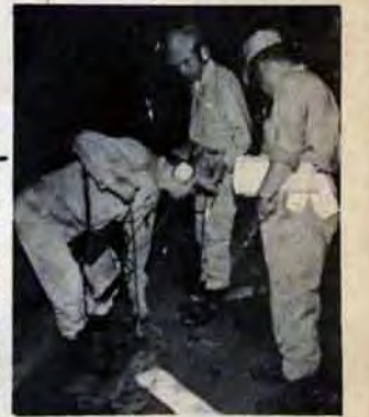
漏水防止にご協力を 写真一深夜、音聴探知器で水もれを探す漏水防止班

配水池よりも住宅のほうが高いと必要な水圧を得ることができません。市内の最も高い配水池は約六十メートルですが、住宅はさらにその上にどんどん建っていくという現状です。 市では水圧の低い地区の解消のため年次計画をたてて老朽管の取り替えや大きな配水管の敷設などで、水圧の増強をすすめています。