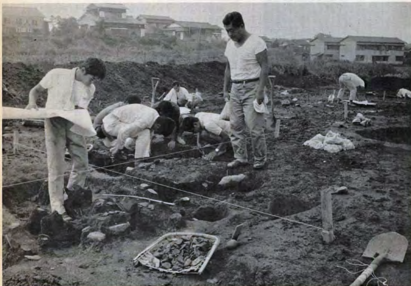
八幡区馬場山の茶屋の原団地造成地で