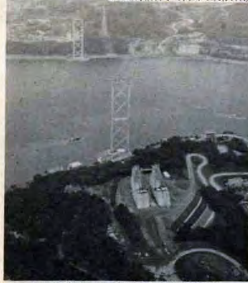
工事中の関門大橋(門司側から)

そこで、48年秋に完成する関門大橋の巨大な人工美と雄大な海峡の自然美を利用して、四十三ヘクタールの大観光公園をつくり、一般観光客や北九州港を訪れる外国人を招きよせる一方、市民のレク