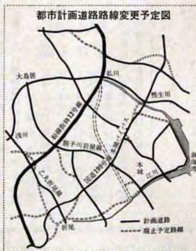
都市計画道路路線変更予定図

聞きます。路線変更に関係ある人は説明会においでください。〔説明会の日程〕9月6日(折尾西公民館、7日(本城公民館、8日(二高公民館。いずれも時間は午後7時から9時まで。〔変更予定の路線とおもな経過地〕▽幹線道路十二号線(若松区弘川・塩屋・柿ヶ谷、八幡区折尾大池、▽国道一九九号線(若松区鴨生田、八幡区御開・的場・国鉄豊線西側沿い・折尾日吉町・折尾大池、▽折尾川岩屋線(八幡区本城・本城中学校横・蛭子谷、若松区浅川柿ヶ谷、▽乙折尾線(八幡区浅川通り奥道沿い、若松区浅川地内の奥道沿い、▽本城西区画整理区域内の幹線道路、▽二島区画整理区域内の幹線道路