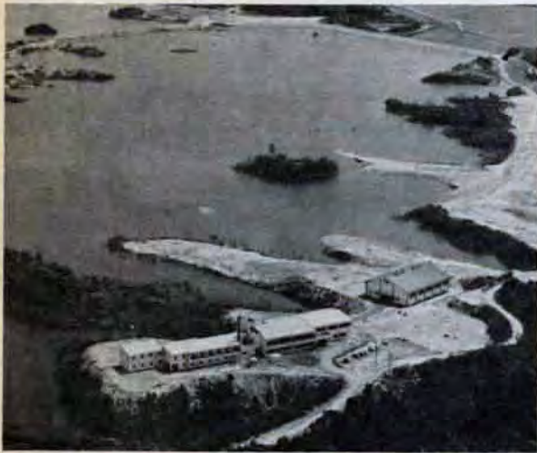
碩田野水池と市立玄海青年の家

体験しにくい協調、奉仕の精神を会得させるとともに、子どもたちに健康管理を自覚させることが「緑の教室」のねらいです。