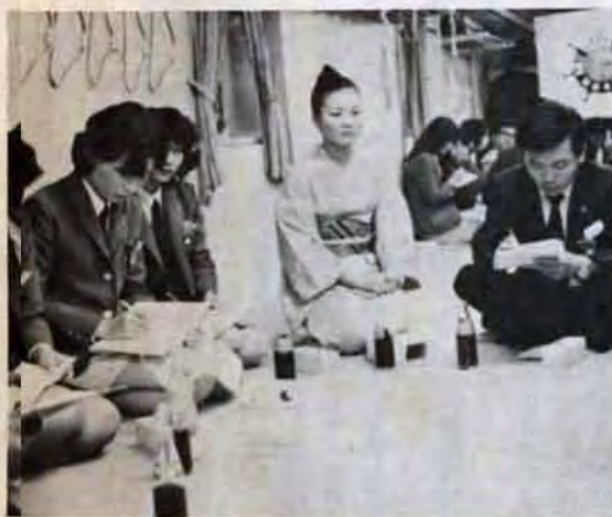
青年との交歓会——「核ゆきの返還」「基地撤退後の」が話題の中心。喜びの中にもきびしさを見せて...