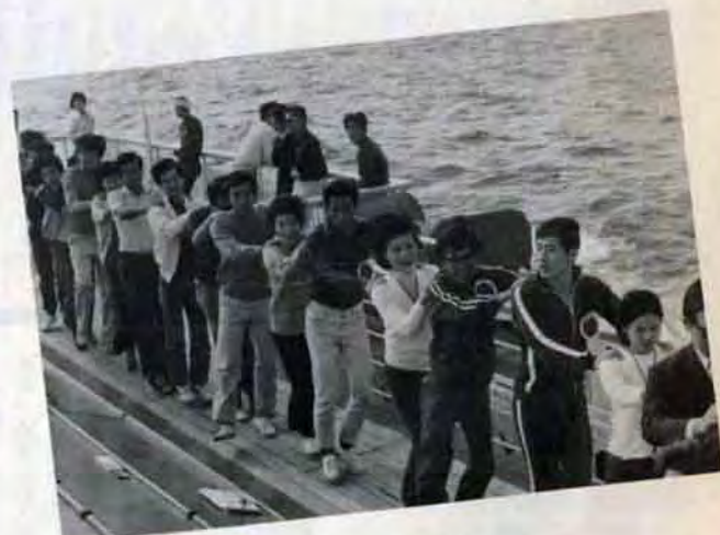
ホイッホイッ/きょうも元気に。船酔いなんかふきとばせ!—朝のつどい