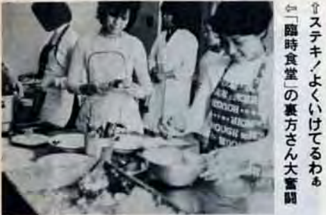
↑ステッキよくいけてるわ ↑「臨時食堂」の裏方さん大奮闘