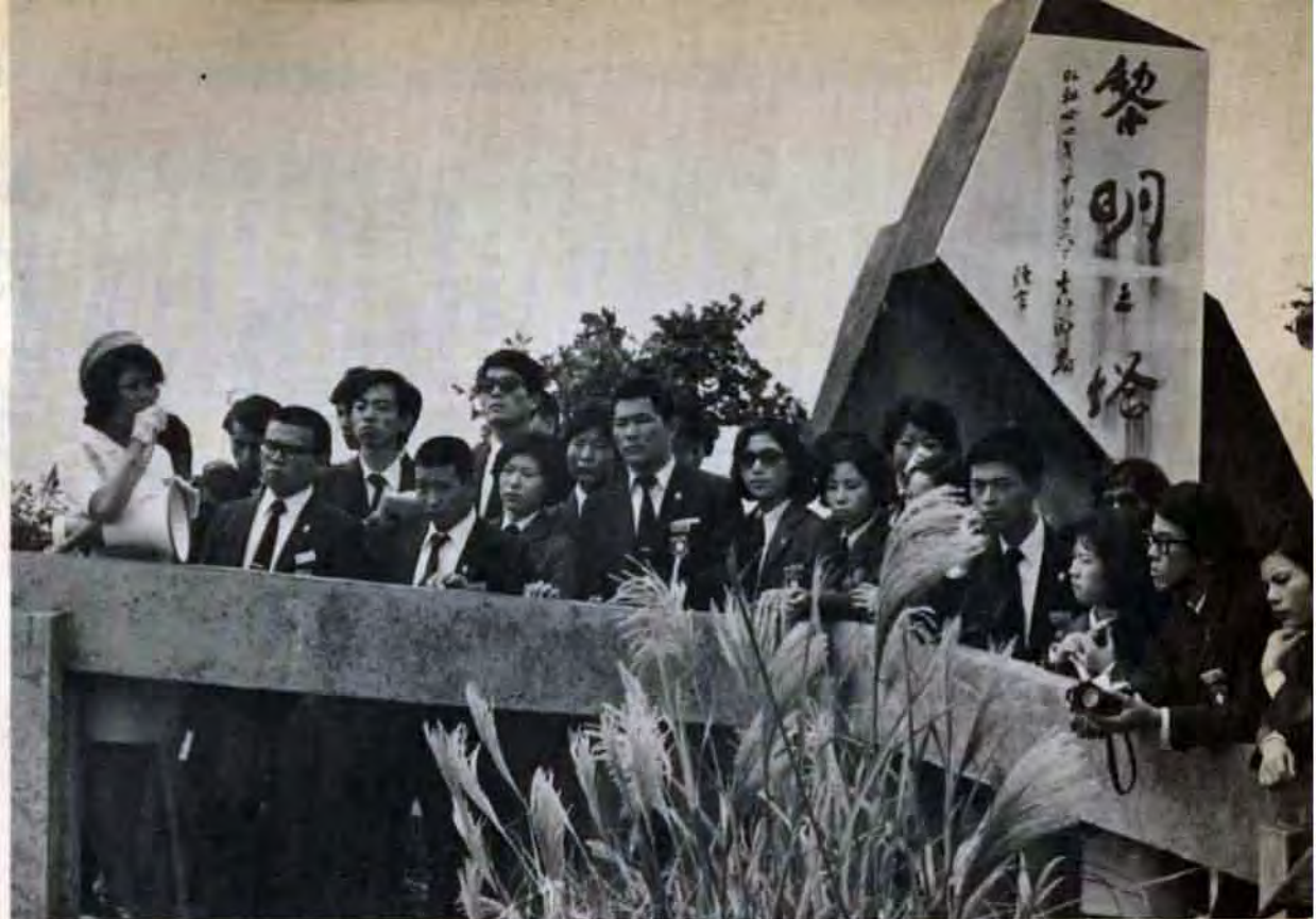
最も悲惨をきわめたといわれる沖縄南部戦跡地。「黎明の塔」からの慰霊碑群を望んで立ちすくむ青年たち