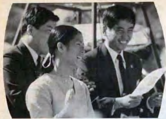
釜山でのグループ別研修——さわやかな笑顔とほがらかな人がらがとても素敵だった孤児院の保母さん