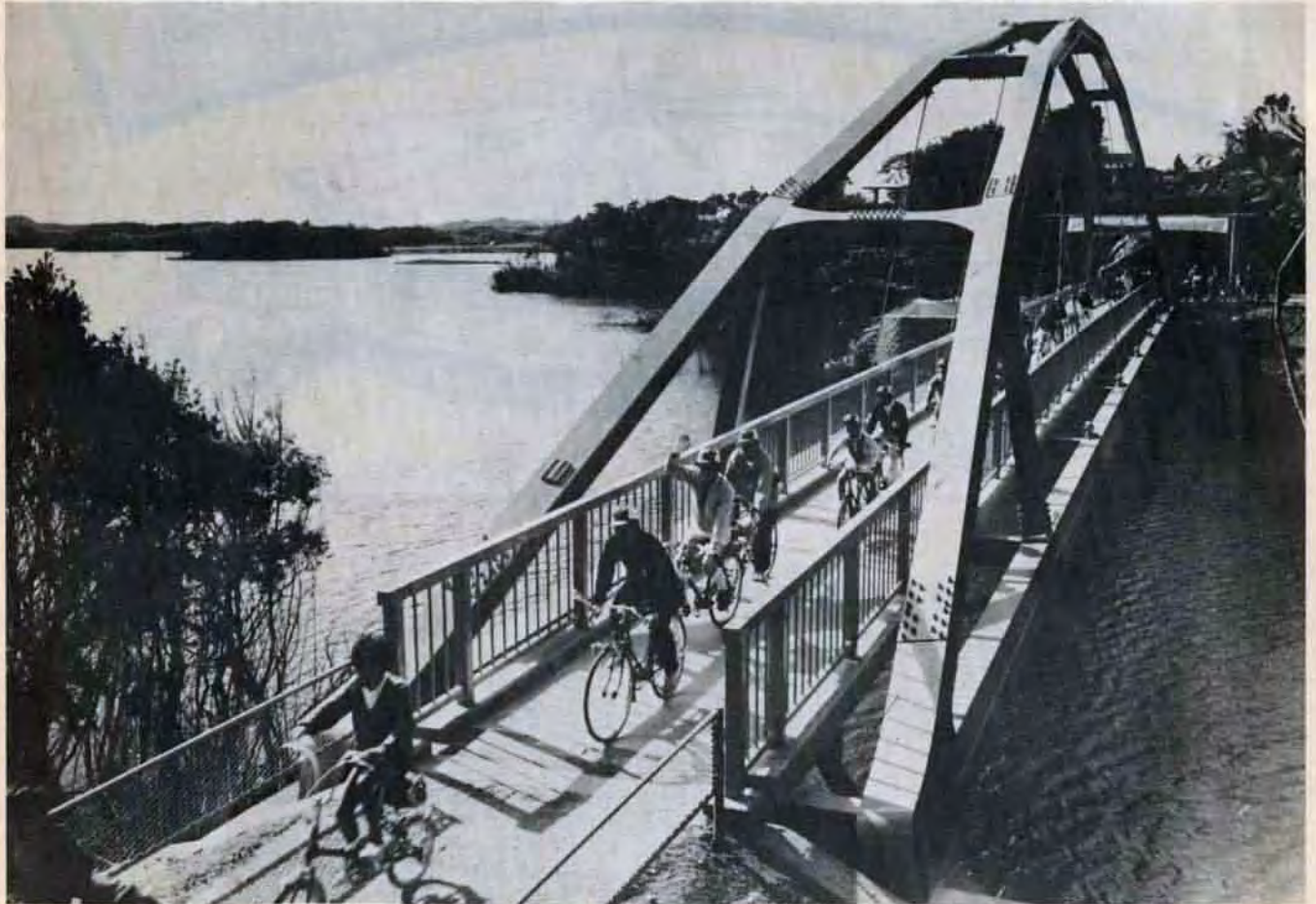
歓声の中一かえて橋、をスタート