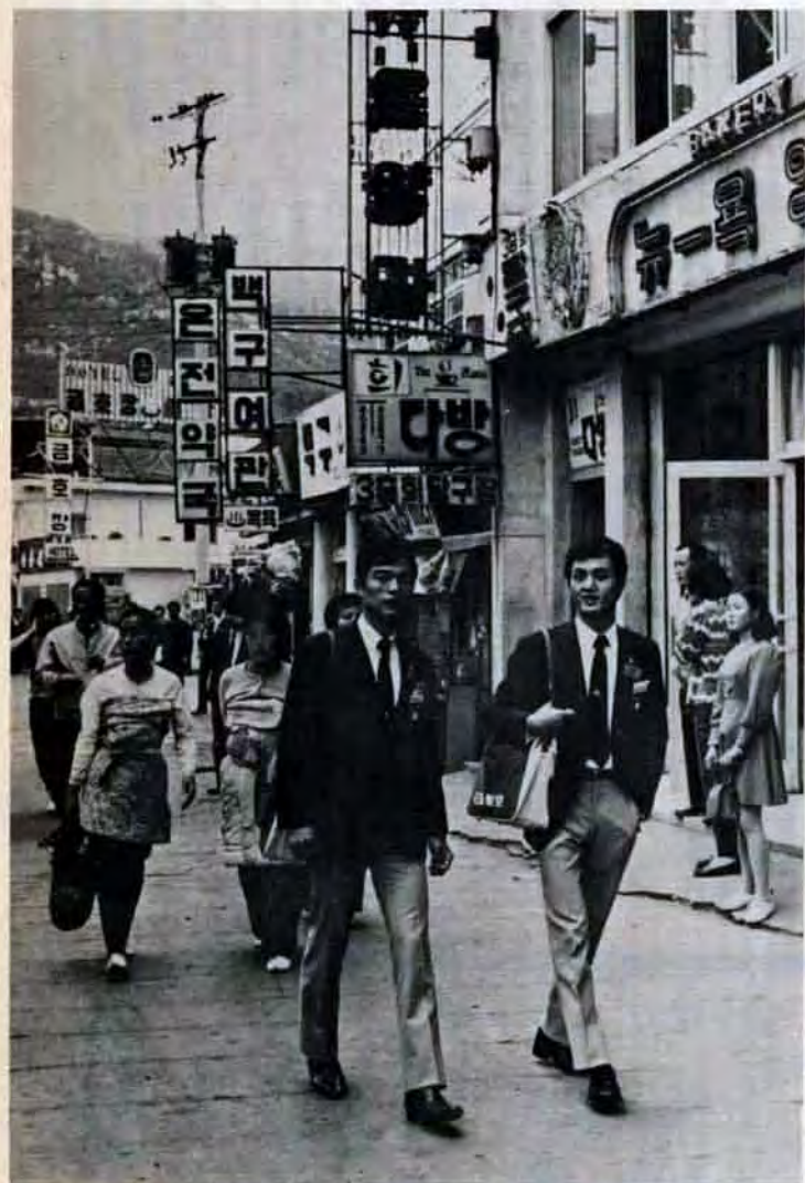
釜山市内を社会見学。身ぶり、手ぶりからカタコトの英語まで総動員。98ウォンが100円というややこしさものりこえて、いざ行かん!

二百五十一人の若者たち 韓国では何を知り 沖縄では何をみつけたか それは、何よりも日本——外から見た日本 たくさんのお友 たくさんのお夢、希望 そして何よりも、若い自分自身の再発見 感想は—— もう、すごく楽しかった もうすこし時間がほしかったなあ 解団式のとき、泣いちゃった 11月1日、門司税関岸壁 八泊九日の日程を終えて 若者たちは帰ってきた しっかりと新しい自分を抱きしめて