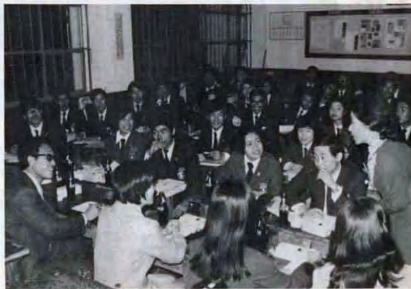
「日本を目標に都市開発と経済復興に力をそいでいます」と明るく、また真剣な表情で話している釜山青年たち。通訳さんも身をのりだしての交歓会