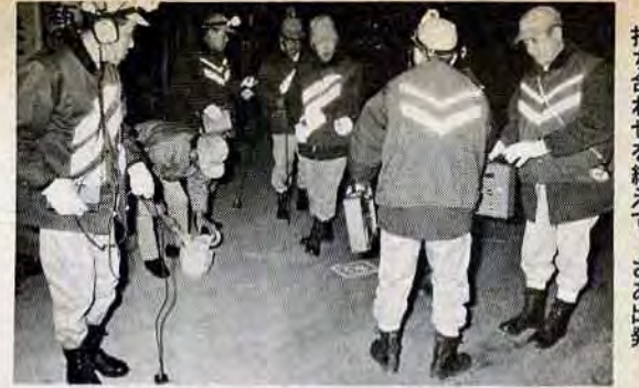
打ち合わせを終えて、さあ出発。