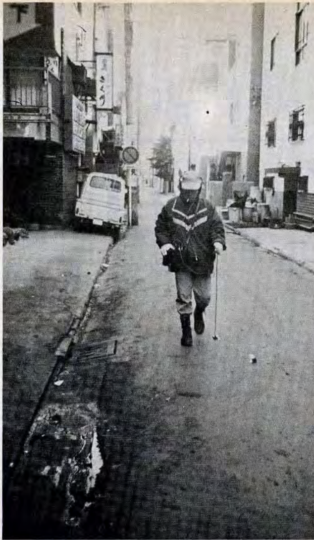
すずめの鳴き声が気持ちいい。防止員たちはさわやかな夜明けをめざして歩いているのかもしれない。

【おわび】 1月15日号市政だより4ページ「一流洋裁士」の記事中「一般の洋裁学校と異なるところは…」とありましたが、一般の洋裁学校も教養科目がありますので、訂正おわびします。