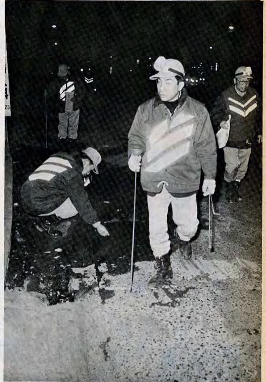
道のすみずみまで目を光らせる。ちょっとでも漏水のうたがいがあれば徹底的に調査する。

水臨時とパート制の 看（准）護婦を募集 市病院長は、臨時とパート制の看護婦、准看護婦を各十名募集します。勤務場所は各市立病院。▽看護婦は昭和2年1月1日以降に生まれた人で看護婦免許を持つ人。臨時は月額千四百十円。パート制は時間割百九十円。 希望者は、市病院長人事課 八幡区新池二丁目1-1、87局7731へ。 ＊訓練生（定時制）募集 福岡県立戸畑専修職業訓練校では、47年度前期の訓練生（定時制）機械科三千名を募集しています。資格は中学卒業程度の学力を持つ人で、①生産工場に働いていてさらに、各種工作機械、溶接及び機械製図の技能を身につけた人。②幅広い技術を身につけた人。③現在失業中で、将来機械工、溶接工として就職したい人。 訓練期間は、4月9日、時間は午後6時～9時。授業料は無料。希望者は、3月10日までに、入校願、健康診断書または身体検査書、写真（上半身、無帽、ライカ版を添え、同訓練校 八幡区東大谷二丁目1番1号、88局3393）か、もよりの職業安定所にお申し込みください。 ＊水外移住研究生を募集 海外移住研修所（群馬県多野郡宮城野）では、ブラジルとアルゼンチンに農業移住を希望する青年男女を訓練します。応募資格は満十八歳から二十五歳の男子五十人。研修期間、4月6日～9月28日。渡航予定10月29日。 希望者は、3月10日までに申込みを。申込手続はくわしくは海外移住事業団福岡県事務所（福岡市博多駅前二丁目9-28、福岡商工会議所ビル内、41局1846）へお問い合わせください。 ＊職業訓練指導員試験 福岡県労働部では、職業訓練指導員の試験を行います。試験は、3月5日午前10時から福岡県立戸畑専修職業訓練校（八幡区東大谷二丁目1-1）で。 資格は各技能検定職種の一級の技能検定に合格した人。 受験手続は、受験申請書、履歴書、一般技能検定に合格したことを証明するもの、手数料千円（証拠紙で納入する）が必要。 申込みは、2月14日から19日までの間に福岡県労働職業訓練課（福岡市天神一丁目1-1、74局5940）へ。 ▽建設工事入札 ▽参加者募集 北九州港管理組合では、同管理組合建設工事入札参加者の申込み受け付けを行なっています。 希望者は、2月21日までに、同管理組合財政課（門司区西海岸一丁目2-17、33局1331）へお申込みください。 申請用紙は、北九州港振興協会（同管理組合内）で売っています。