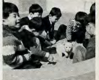
八幡区・明石公園で

2月1日から、通常はがき7円が10円に、封書15円が20円に変わります。ご注意を。 くわしくは、近くの郵便局にお問い合わせください。