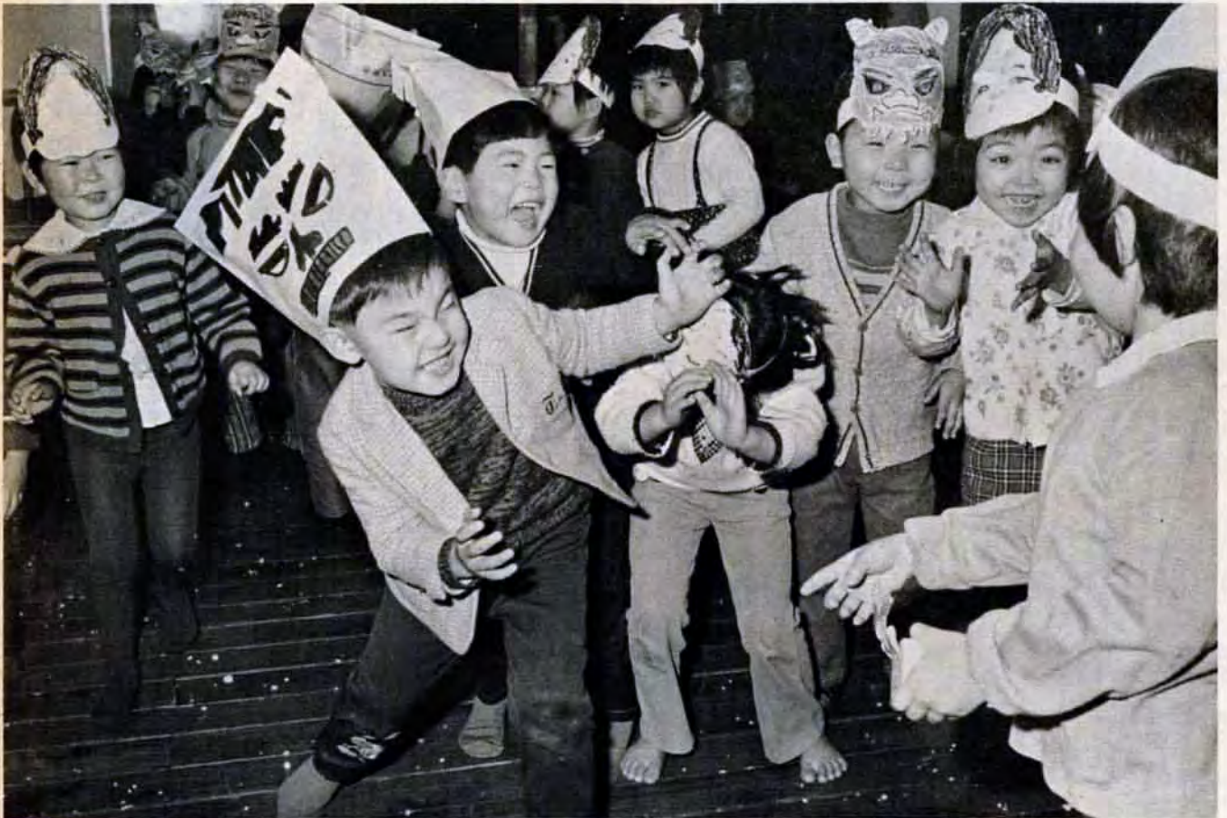
若松区種荷町保育所で