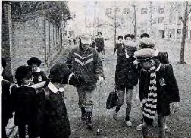
登校中の小学生の一群が、ものめずらしげに寄ってくる。まもなく調査も終わる――。