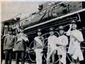
△日本庭園復元式でお茶や尺八、琴の合奏を… ▽一日駅長の子どもとD51

お茶や尺八をかなでる中で日本庭園の復元式が行なわれました。この庭園は小笠原藩主の私生活の場、茶会、能の会などが行なわれていたところです。