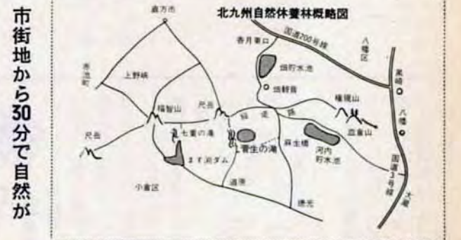
市街地から30分で自然が

また、7月1日にオープンしますが、公害校の児童が使用しない日曜日や夏休みの間は、子ども会などに開放して自然に親しむ拠点にし、また、5月12日に店開きの帆柱ユースホテル、46年度に改装した国民宿舎の上ホテルなどは、ハイカーの宿泊や休憩の便宜をはかり、自然休養林を一層充実させてくれます。