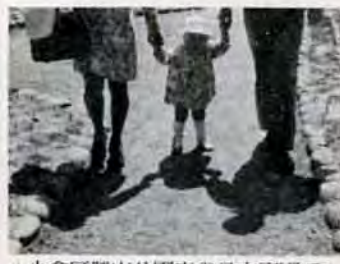
小倉区勝山公園内の日本庭園で