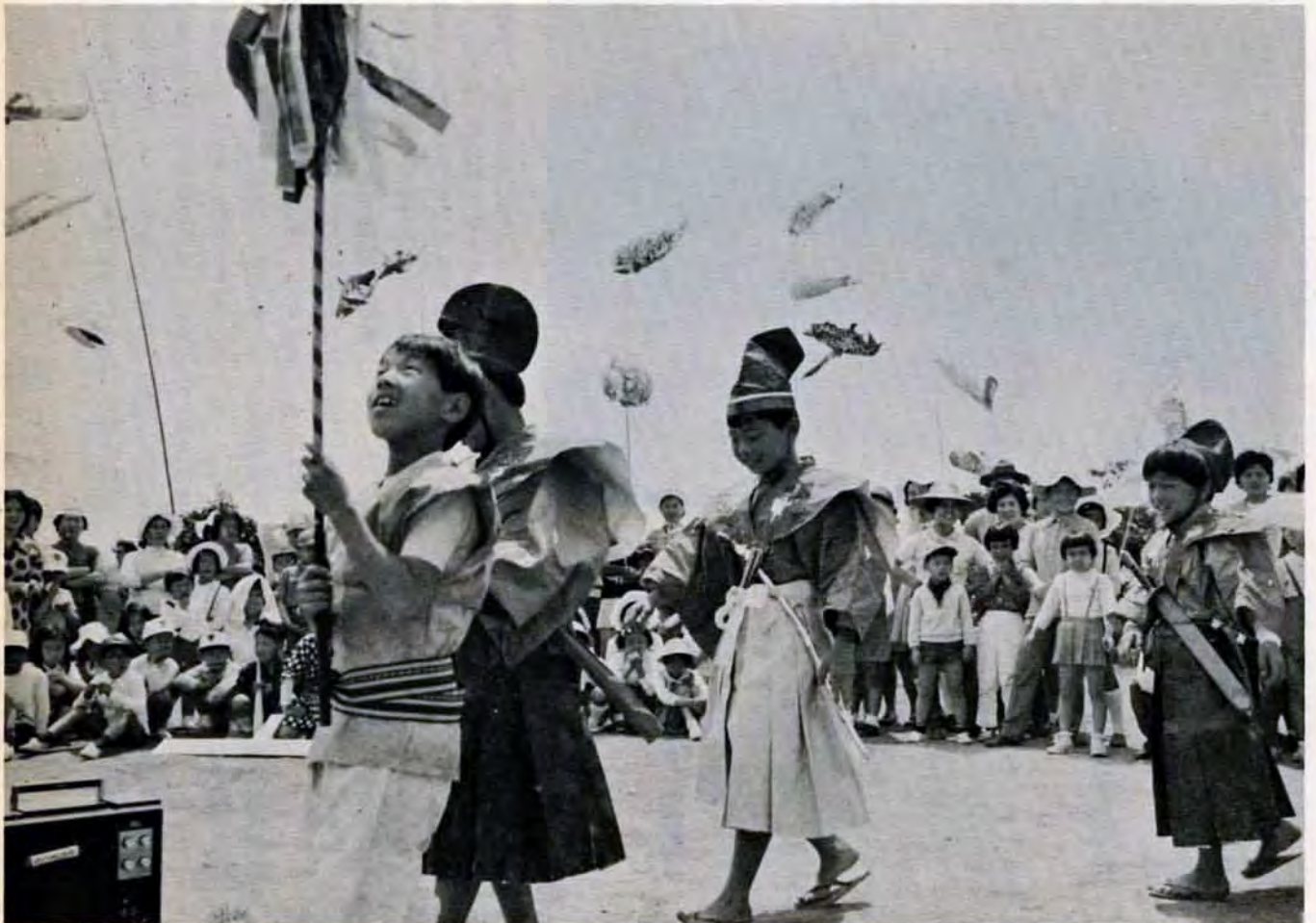
5月7日戸畑区金比羅公園で

毎月2回1日・15日北九州市発行 39年4月15日・第三種郵便物認可 4月1日現在の人口 ▶総数1,042,231人 ▶男504,106人 ▶女538,125人