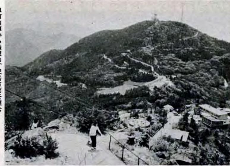
皿倉山頂から権現山、尺岳方面を望む

岩手県ではブルドーザーが、シラカバの原生林を破壊して問題になっています。また、全国的に観光開発などで山や緑が失われ、現在ではこれらは希少価値のものになりつつあります。