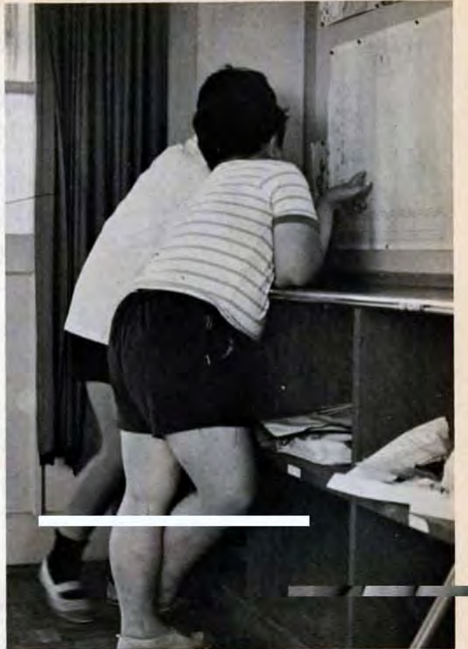
毎週1回体重をはかって、グラフに書きこむ。まだ3か月しかたっていないが、ほとんどの子が下降線を示しはじめた