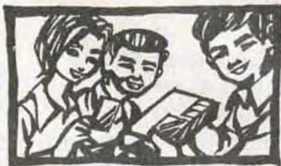
カセット・メイト

働く青少年に勤労意欲をもたせ、社会人としての教養を身につけてもらう。という「カセット・メイト」を7月から始めます。