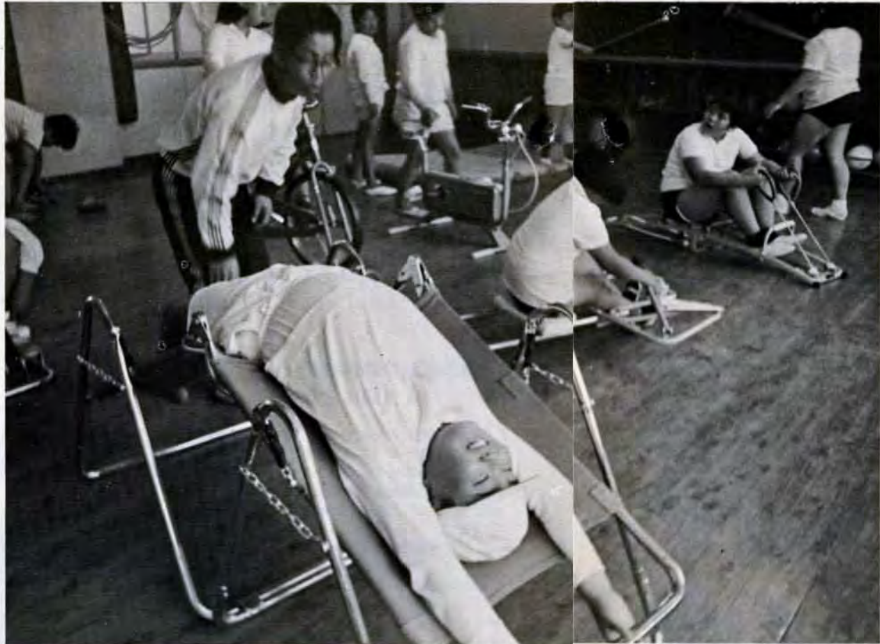
6時間目が終わり、ほかの子どもたちが帰ったあと、この学級の特訓が始まる。ヤンバラを始める子もいて結構楽しそう