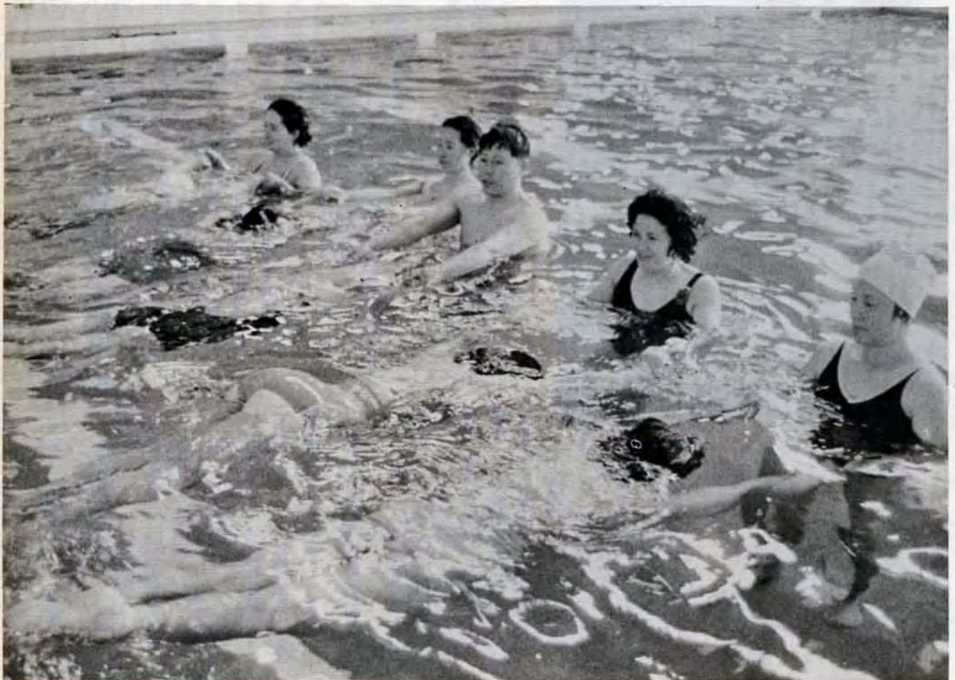
6月6日行なわれた「婦人水泳教室」(桃園室内プールで)