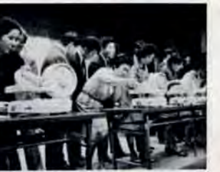
早く正確に計量 6月7日の計量記念日に行なった「減量コンクール」の一コマ。

6月30日午後1時~5時、小倉市医師会館(小倉区中島本町)で。受講料は防火協会員1人300円(会員以外500円)。希望者は6月26日までに消防署内部防炎協会へ申込みを。