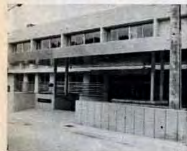
開所を待つ障害福祉センター

ところが、市と北九州青年会議所が中心となって、市内中小企業に働く若者に、カセット・テープを貸出しするものです。はじめはカセットコーダー百台(市が半額負担)とテープ三百本を購入。市内約千社・従業員八千五百人を対象に行ないます。