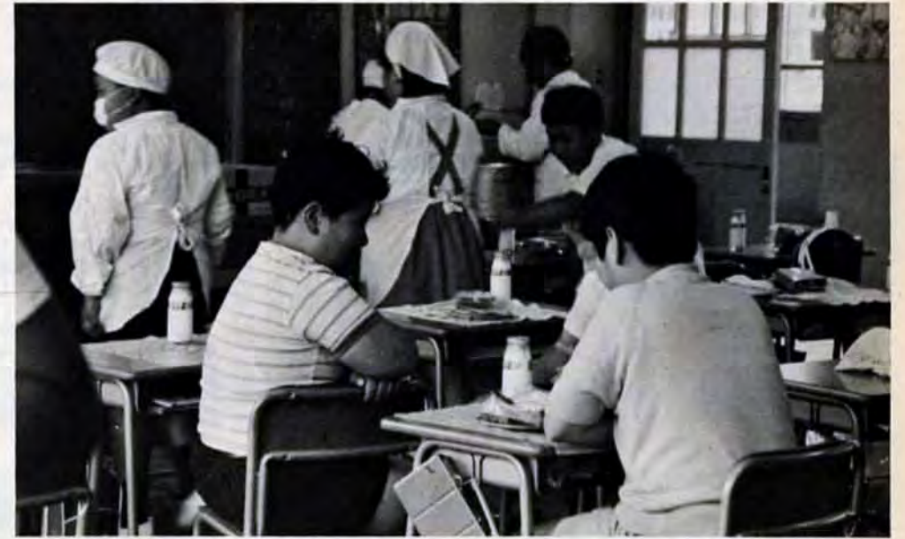
給食の献立は普通学級と同じ。節食もさることながら、バランスのとれた食事が何よりも大切だ

▲上級 ▽一般事務四十五人。資格は、大学または大学院を、ことし卒業か来春卒業見込みで、昭和21年4月2日以降に生まれた人。 ▽電気、機械各十人。生物四一人。土木十八人。建築十二人。 化学六人。造園九人。農芸化学五人。農業三人。畜産、物理若干名。資格は、大学または大学院のそれぞれの専門課程を修了し、昭和44年3月以降に卒業か来春までに卒業見込みで、昭和20年4月2日以降に生まれた男子(生物と化学は女子でも可)。