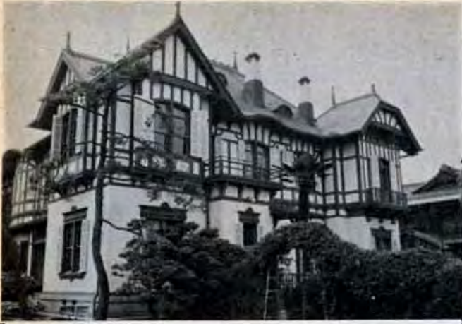
旧松本邸〔西日本工業倶楽部〕