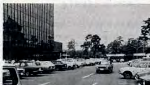
庁舎敷地には、約四百三十台の車が収容できる駐車場があります。