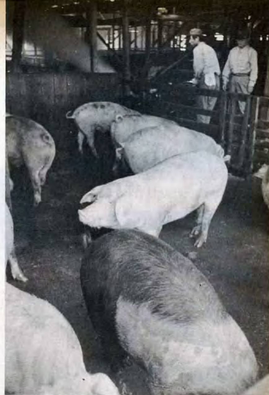
日本脳炎のウイルスは豚の体内で増殖する。特に念入りな薬剤散布を行なう

防疫員たちは、「緑の下の力持ち」であるだけに、地域ぐるみの草刈運動など年ごとに増えてきた市民のみなさんの積極的な理解と協力に大いに力づけられています