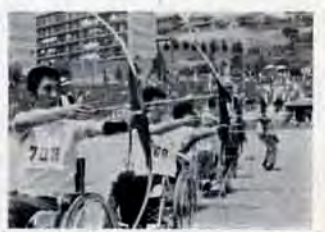
6月11日戸畑区鶴ヶ谷陸上競技場で行なわれた身障者体育大会

対象は、婦人団体などの指導者六十人。日程は、8月21日・22日・28日・29日・31日・9月1日。