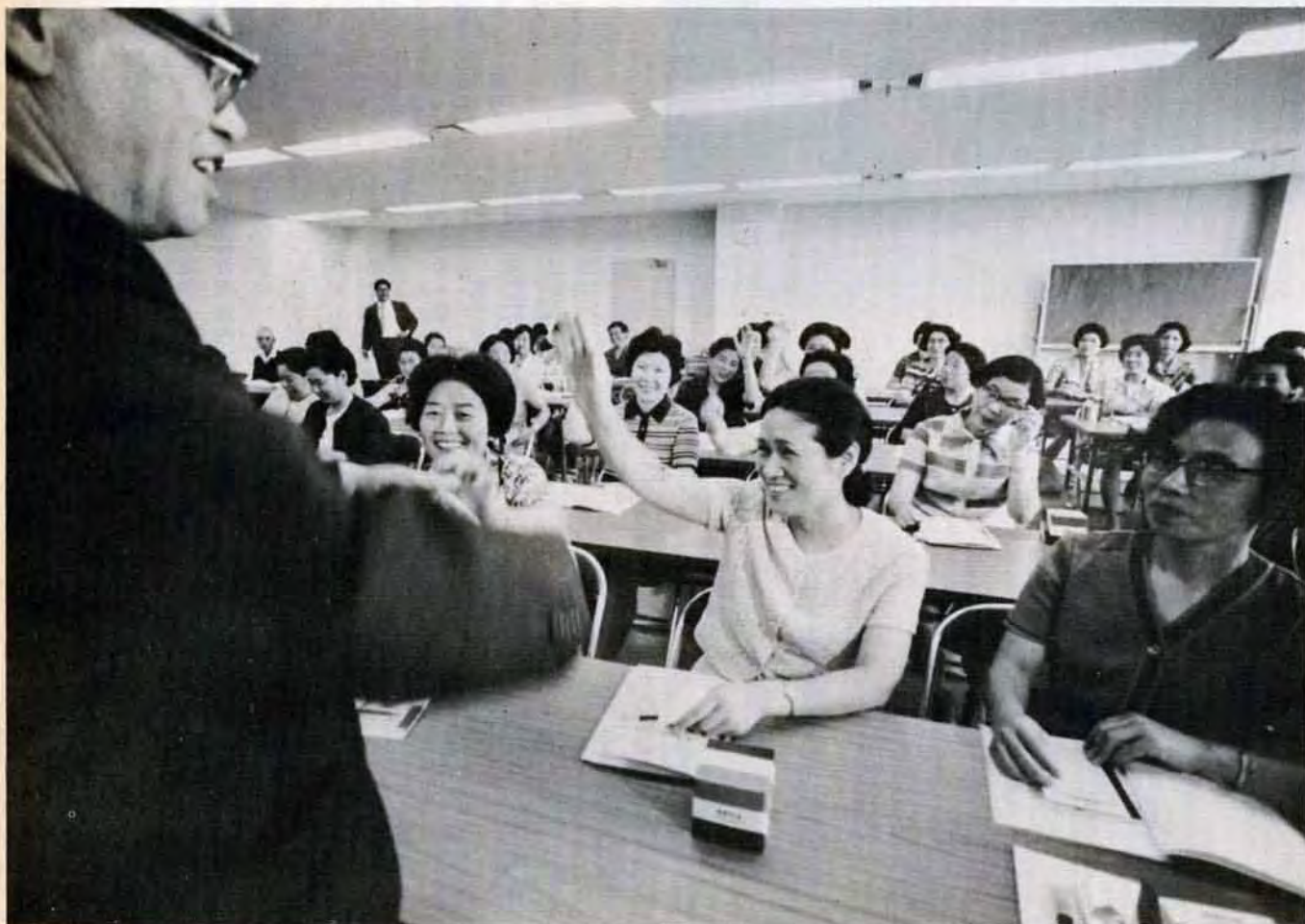
6月21日市役所会議室で