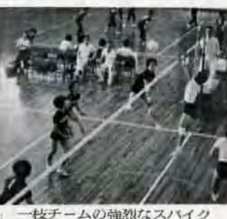
一校チームの強烈なスパイク

百日せき・ジフ混合テリア・破傷風 一期二回目と二期 対象は、①一期 生後三か月から六か月までの赤ちゃん、六か月以上たっても接種していない人(三週間から四週間おきに三回接種。今回は二回目の人) ②二期 一期の接種をおわり、十二か月から十八か月たっている人(一回接種してください) ◇接種は開業医院で。▽二期二回目と二期