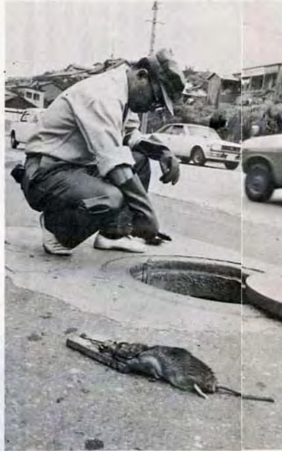
ネズミとりも重要な仕事のひとつ 1日に100匹もとれることがある

▷市防疫所＝小倉区井畑二 571局6636 ▷東部駆除係＝小倉区役所内 561局4131 ▷中部駆除係＝戸畑区川代二海岸ビル内 871局3460 ▷西部駆除係＝八幡区西本町一丁目八幡給食会館661局2067