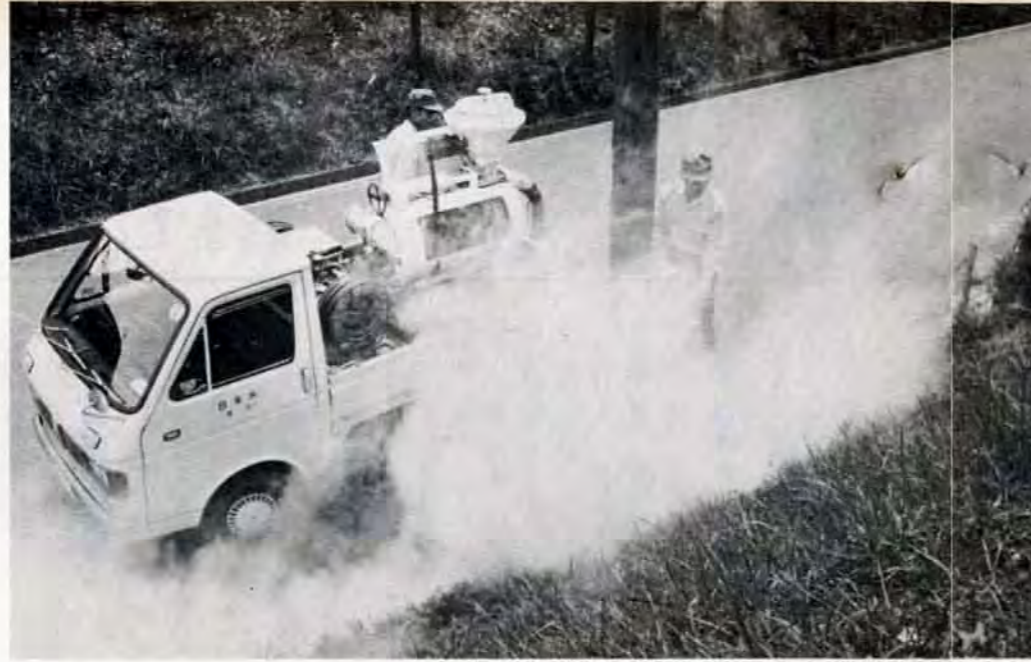
汗とほこり、薬剤にまみれる防疫員たち。夏はかからず負どきだ

〔宇宙科学館入場料〕…小学生50円、中・高校生70円、おとな100円。ただし、7月7日～9日までは親子づれの子供は無料 ※本紙6月15日号で「宇宙科学館は月曜が休館…」とお知らせしましたが、「第2、第4日曜日の翌日（月曜）と第1、第3、第5日曜日が休館…」の誤りでした。おわびして訂正します。