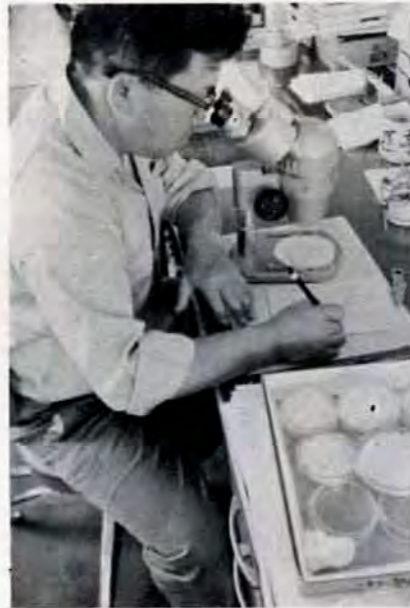
最も効果的な薬剤散布の研究 —蚊の動向などを調査する