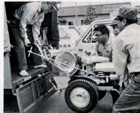
ヨイイショノ 噴霧機など機材の点検、準備から一日が始まる