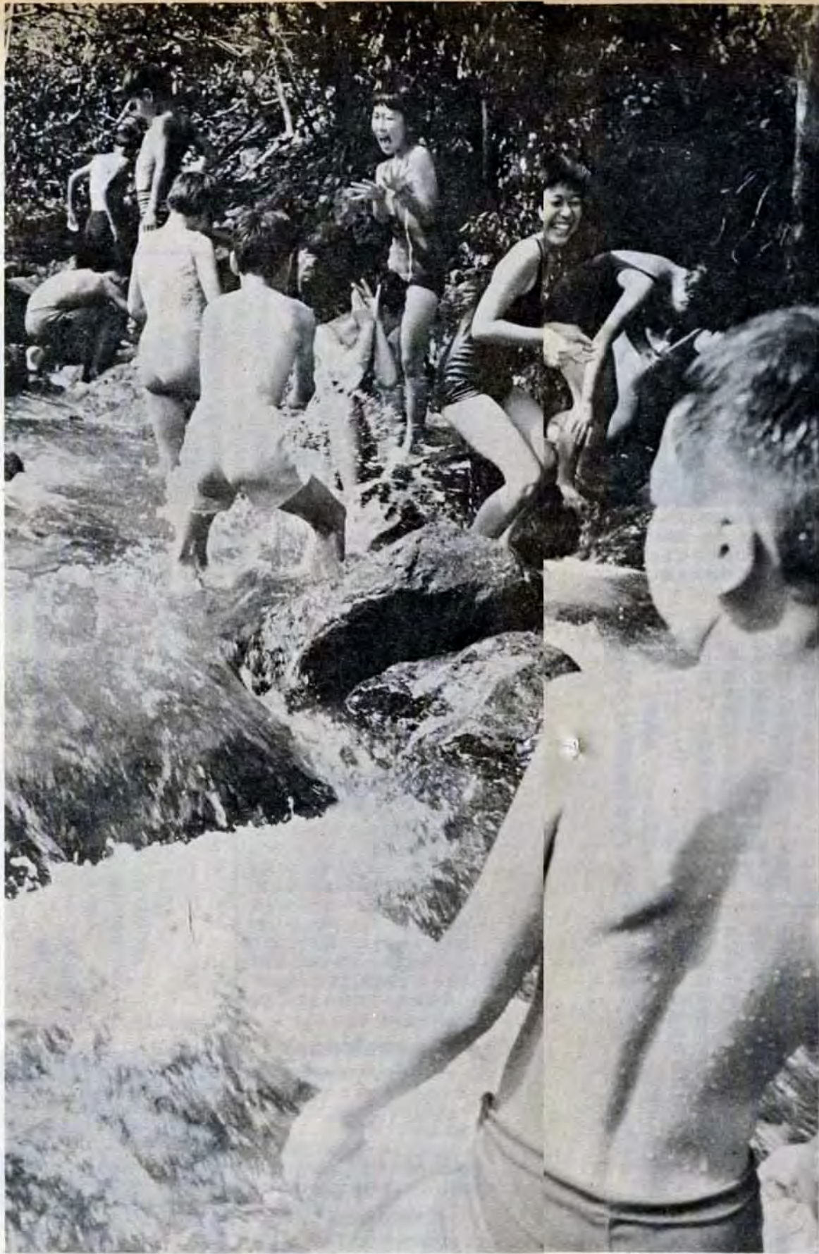
澄みきった山水の冷たさに歓声が絶えない。カニだ！これナニ？ 子らには何もかもが目新しい

来年2月10日で、北九州市が発足して十周年を迎えます。市は、これを記念して「あすの北九州市」をテーマに昭和60年代の北九州市の姿をえがいていただくとともに、今後どのような課題があるのか、解決方法は、などいろいろな問題を考えていただくために、論文を募集します。 ▽テーマ「あすの北九州市」 ▽応募資格 特に関係ありません ▽原稿枚数 主論文：四百字詰原稿用紙三十枚以内（グラフ、図表などを含む） 論文要旨：四百字詰原稿用紙三枚以内で別にとしる。 ▽賞 最優秀一編十万円・優秀二編各五万円・佳作若干各一万円。 ▽送り先 10月31日までに市企画局行政課（☎803小倉区城内1-1、552局2160）へ。