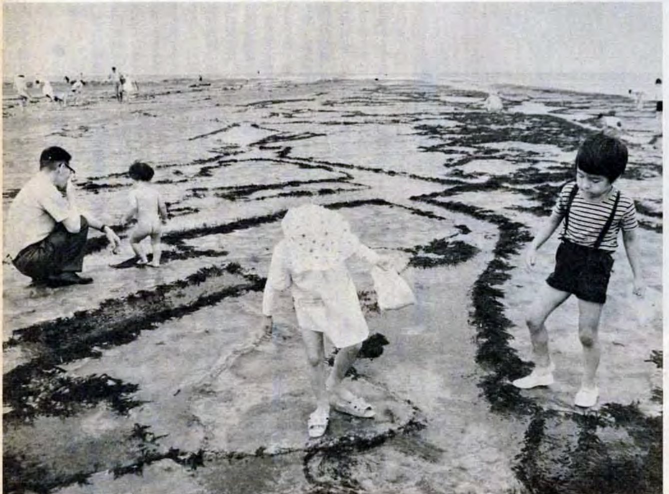
7月9日 若松区千畳敷で