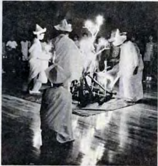
キャンドルの火のもとで友情を誓いあう