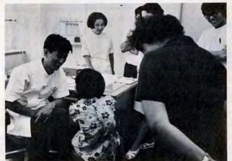
診断・判定——身障者の心をときほぐし 友だちになることから始まる