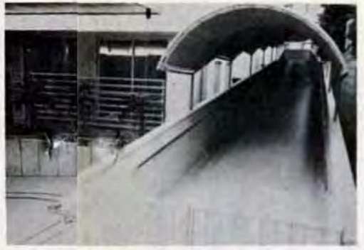
スロープ——二階の機能回復訓練室に車イスのままではいれる