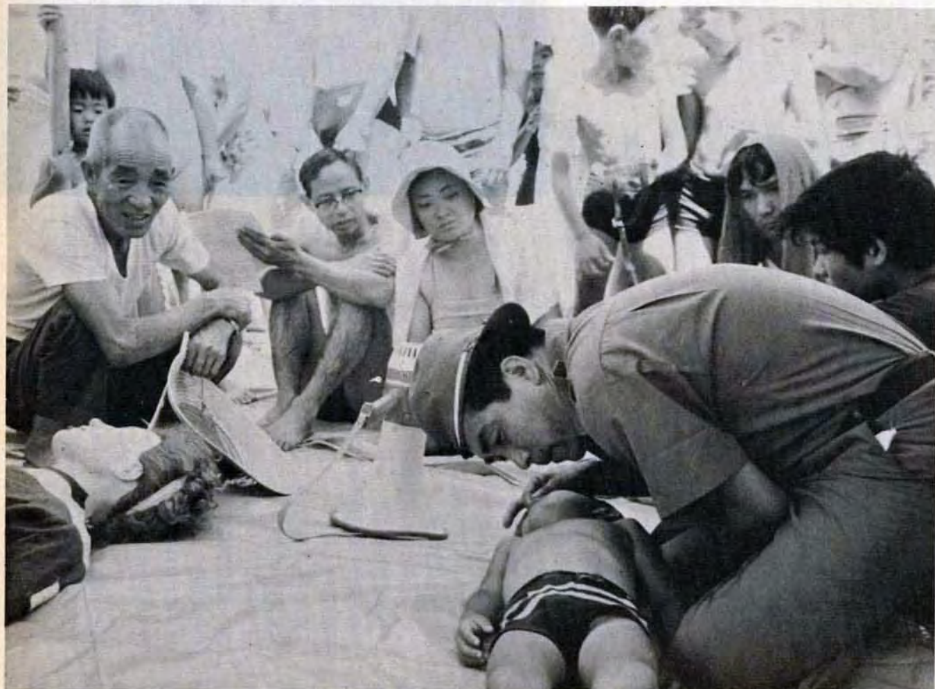
8月4日、若松区脇田海水浴場で