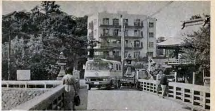
きょうも町角から町角へ