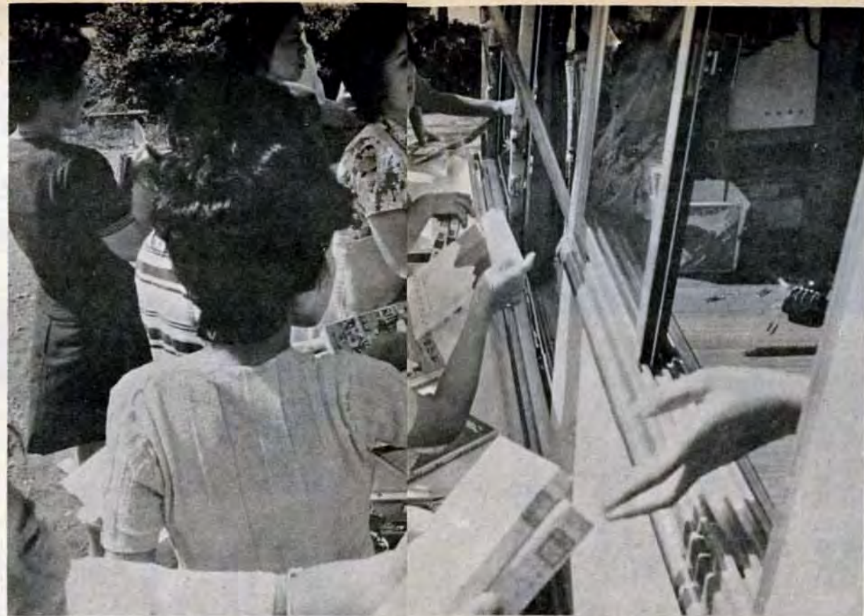
1台に約千冊。エフロン姿や買物カゴを持った奥さんが気軽に立ち寄り

市の図書館は、各区に一館ずつ。主な仕事—図書資料の閲覧・貸出し・複写サービス、知識や情報の相談事務(レファレンスサービス)など—の中に「自動車文庫」があります。これは、忙しいとか遠いとかで図書館の利用が困難な人のためのものです。団地や住宅、広場、公園、公民館などに百六十一ステーションを設け、4台の車で巡回し、図書資料を貸出しています。 自動車文庫は、昭和29年に、八幡図書館が約十ステーション、利用者約百人でスタート。現在、利用者は個人四千四百十人、団体六十一にふえました。 利用者は、奥さんとチッコが多く、料理や編物の本、おとぎ話や絵本などがよく出ています。このほか、文学書や推理・時代小説などがあります。また、リクエスト方式を取入れたりして、みなさんの要望に応じられるように、利用しやすいように努めています。 「ベストセラーなどはたくさんの方が読みたがっているのですが数が少ないのと一か月に一〜二回の巡回ということで、思うようにいかないのが残念」と係員。 それでも、ステーションに行く、待ちかねていたように奥さんたちがどっと集まってきました。この文庫で顔なじみになった人たちが、換でなかなかきやか。 さわやかな季節—長い夜を讀書ですぐすも楽しいものです。あなたも気軽にご利用ください。