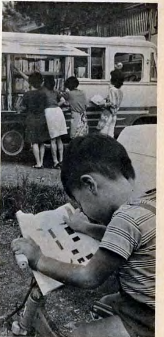
さっそく絵本を開くチッコもいる