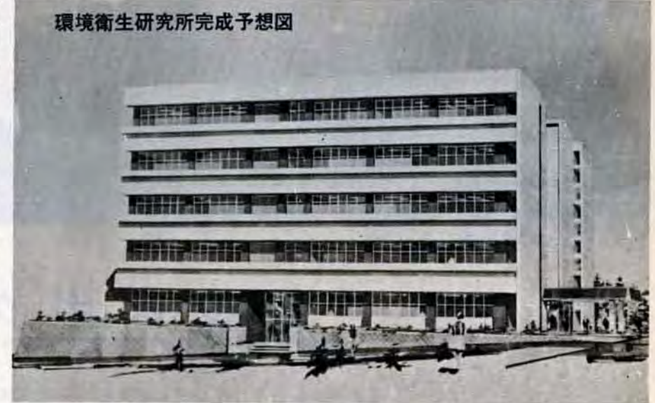
環境衛生研究所完成予想図

最新の研究機器を備え衛生行政の情報センターとしても、その機能をフルに発揮できる 二階は管理部門で、事務室のほか、必要な情報を収集・整理し市生活向上に役立たせるための調査企画・資料統計室など広いスペースを確保しています。 三階は大気、水質などの実験室、原子吸光分析室など。 四階は食品化学実験室、恒温恒湿実験室、放射能計測室、農薬やPCB検査をするガスクロマト分析室など。 五階は微生物実験室、病理組織検査室、魚をつかって川や海の汚染度を調べるTLM実験室、産業廃棄物処理の研究をする衛生工学実験室を配置。将来に備えて各室とも広いスペースで設計しています。 また、研究に使用した廃水、廃ガスなどは研究所内で完全処理を行うことを始め非常災害のときの避難通路など安全面については、とくに配慮しています。