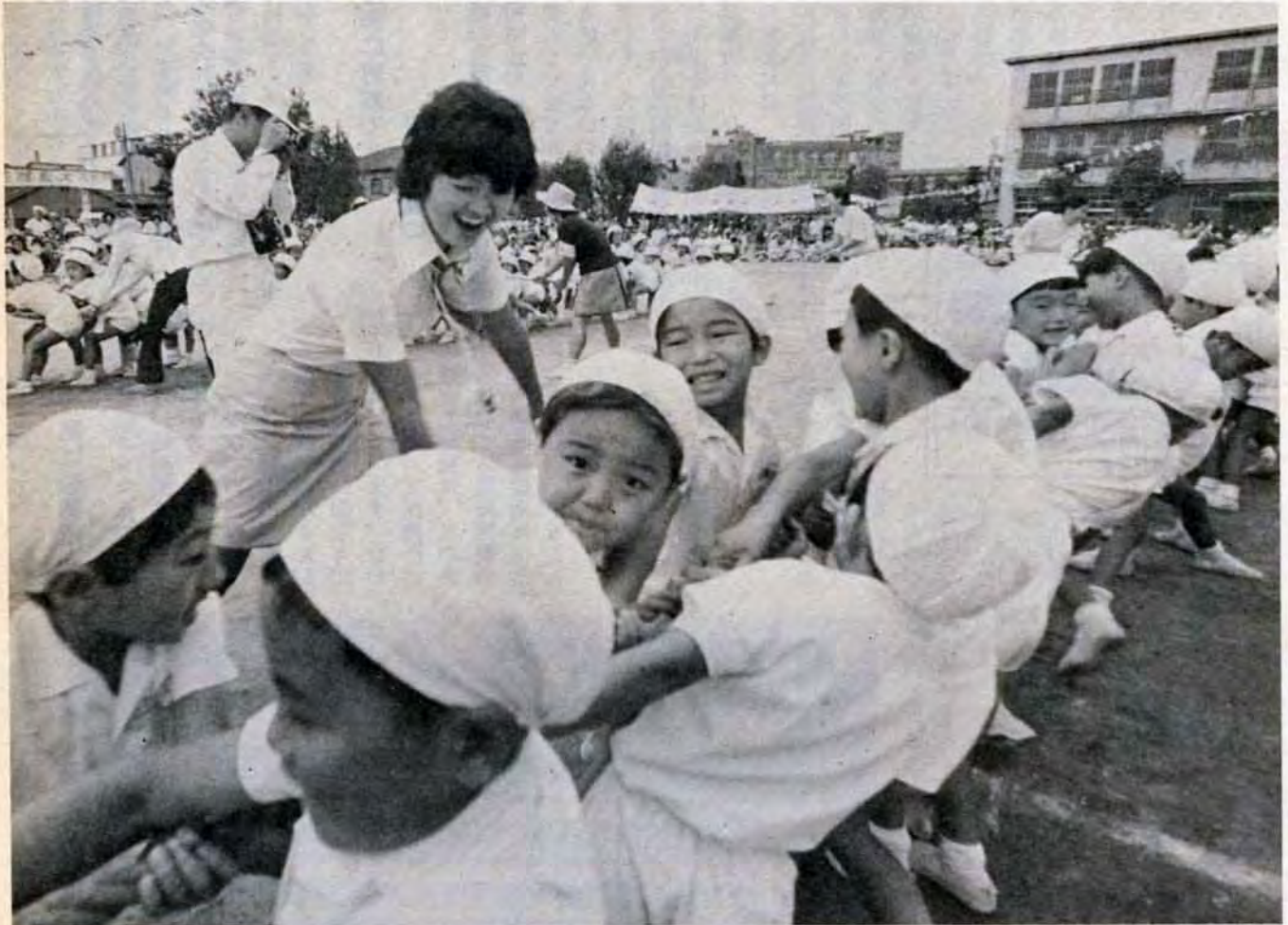
9月23日 若松小学校校庭で