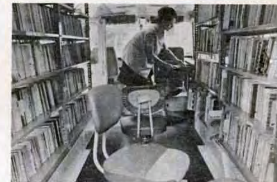
本の整理が終わるとカード整理が待っている