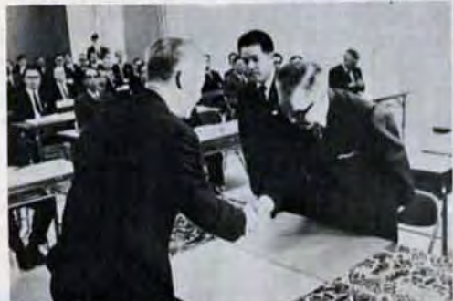
公害防止対策をさらに強化、市内54工場と防止協定を結びました。