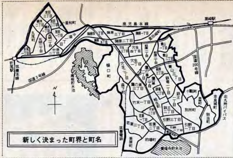
新しく決まった町界と町名