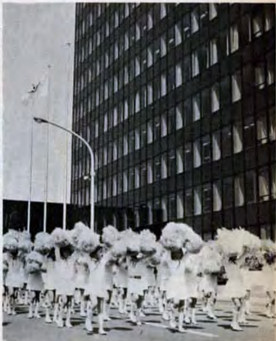
新市庁舎開庁。市民のみなさんが気軽に利用できるよう市民ホール、展望室などを完備。