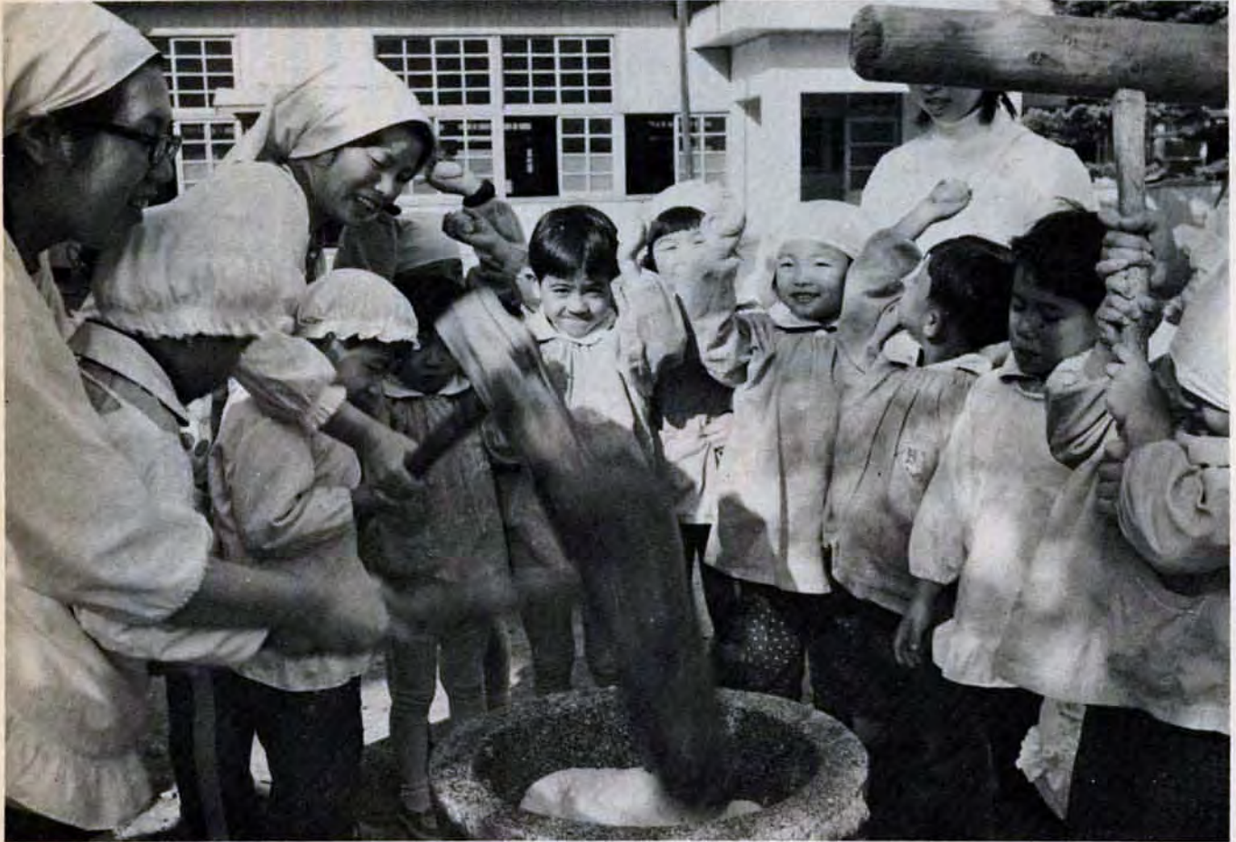
12月5日 小倉区旭ヶ丘保育園で