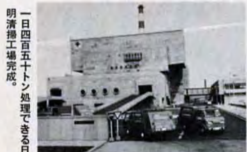
一日四百五十トン処理できる日明清掃工場完成。