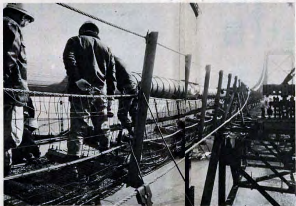
「関門橋」ドッキング。来年秋完成をめざし工事は急ピッチ。

■助産婦・看護婦 ▽助産婦：昭和3年4月2日以降に生まれ、助産婦と看護婦免許を持つか来春取得見込みの人。若干名。初任給四万二千八百六十円〜四万四千九百四十円。 ▽看護婦：昭和8年4月2日以降に生まれ、看護婦免許を持つか来春取得見込みの人。若干名。初任給三万五千六百十円〜四万一千八百八十円。