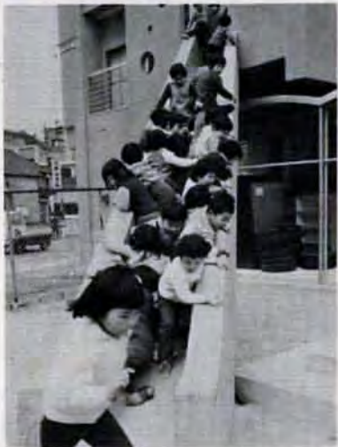
市内の保育所は百か所を超え、一万人保育達成もまじかです。