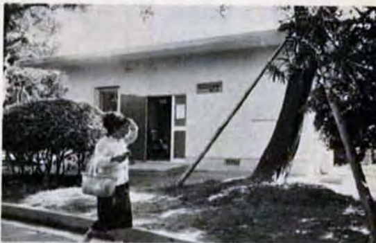
おとしよりの社交場「老人いこいの家」を市内45か所に設置しました。

昨年末から引き続いたドルショックの影響が現われ、新年からきびしいスタートとなりました。市は、1,700億円の大予算を組み、中期計画のテンポを早め、経済事情の緩和に努めました。ことは、*人間性を尊重したまちづくり。をモットーに、福祉の向上と生活環境の整備に力を入れてきました。保育所の新設、増築で一万人保育も達成まじかです。老人医療費の無料化、老人いこいの家を市内各所につくるなど、きめ細かく福祉の向上を推し進めました。 環境面では、公害防止対策として、54工場との防止協定締結、大気・水質汚染についても具体的に取り組みました。ゴミ処理は、日明に続いて皇后崎に大型清掃工場の建設に取りかかりました。下水道も予定どおり建設が進み、*美しい町づくり。も着実にその成果をあげています。自然林の整備、市街地の再開発、交通体系、港の整備なども具体化し昭和48年には、*大都市にふさわしいまちづくり。の形が一段と整って、新しい北九州市の発展が約束されています。