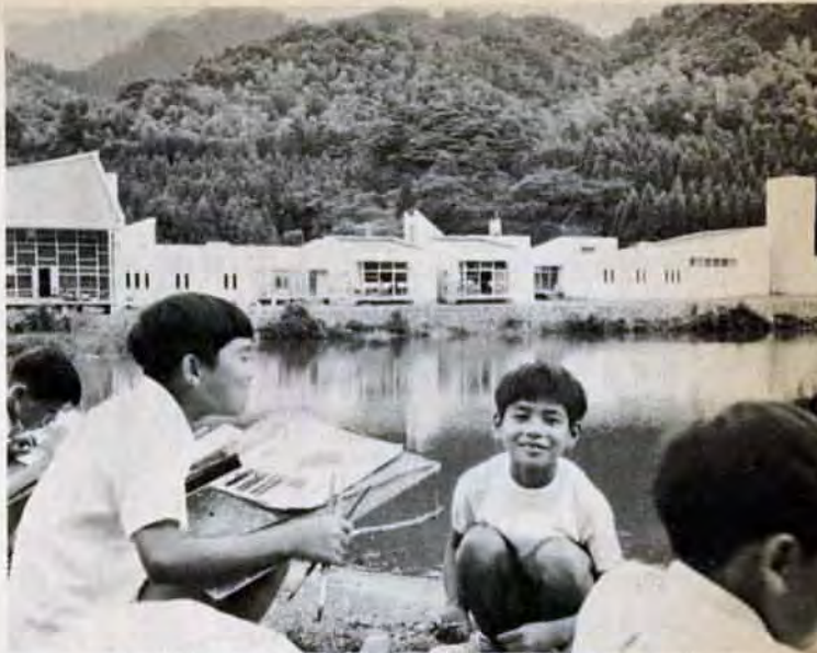
頂吉貯水池のほとりに完成した「少年自然の家」。恵まれた環境の中で、児童たちはのびのびと生活しました。