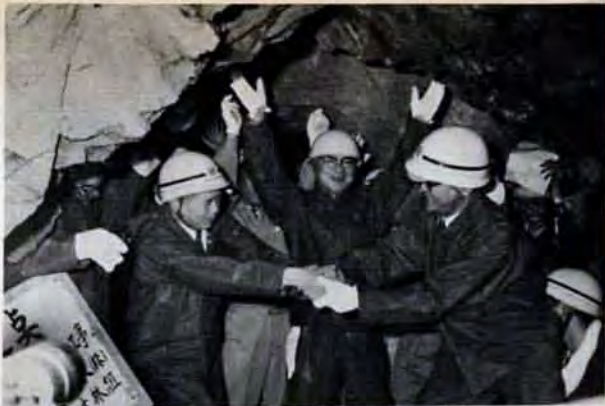
油木ダムから27キロのトンネルを通して、毎日約10万トンを送水。水資源開発は日夜続けられています。