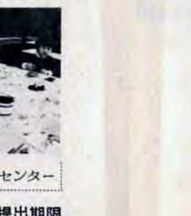
年賀状作り・児童文化センター

八幡美術展 八幡区尾倉三丁目 51局5414 八幡区総合文化祭書道展 12月19日、24日、書道展。無料 八幡区新成人作品展 11月14日、16日。絵画、工芸、彫刻写真、書道。無料。▽福岡教育大県人会書道展 11月27日、29日。書。無料。 児童文化 八幡区尾倉三丁目 51局4566 ヴクリスマスとも会 12月24日午前10時から。映画会、歌、影絵など。▽とも会と焼き 11月14日午前10時から。もちつき、どんど焼きなど。しめかざり、おもち、▽おめん作り大会 11月28日午前10時、午後3時。材料として、あじ箱、毛糸などを持参してください。 ●プラネタリウム 12月のテーマは「東西星の位置」、1月のテーマは「昭和基地の白夜」宇宙科学館(八幡区桃園三丁目 51局4566)で、毎日五回上映。休日は、12月25日、29日、31日、1月1日、3日、7日、15日、21日、29日。料金はおとな百円、中学生七十円、小学生五十円。 ●小倉城 12月22日大鏡餅かきり。▽29日、31日休み。▽1月1日除夜祭・先着百人に輪舞進呈。▽1月2日学生書初め大会。●スキー教室 11月20日、24日、大山スキー場。募集は三十六人。会費は七千五百円(交通費宿泊費、講習費)。希望者は、市教育委員会体育課 582局2395、北九州市レクリエーション協会 51局2777へお申し込みを。