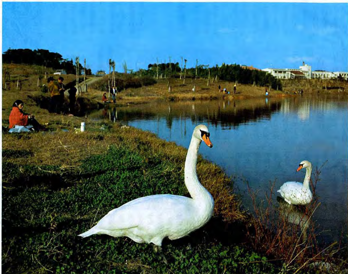
若松区頓田貯水池