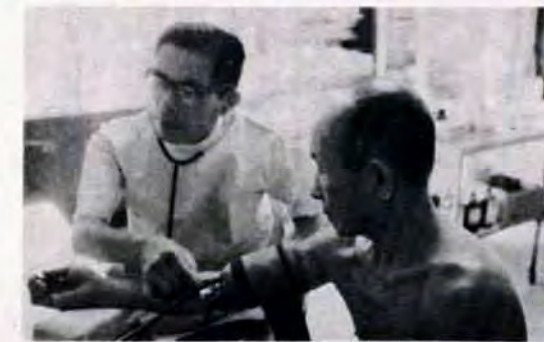
43年・老人健康診査無料化開始