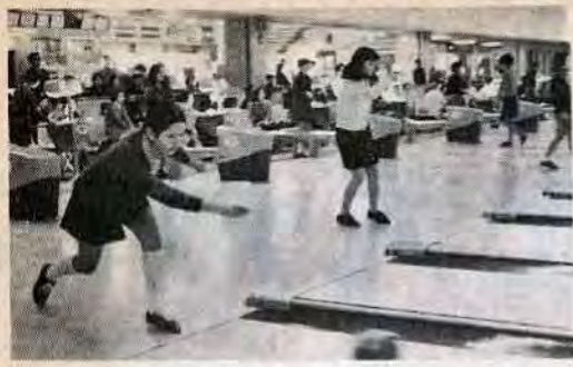
休日にはボウリング場も若い人でいっぱい