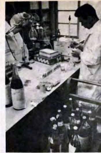
40年・衛生研究所活動開始

北九州市は、世界の自治史上例のない、門司・小倉・若松・八幡・戸畑の旧五市が対等に合併して、昭和38年に誕生。以来着々と大都市づくりを進め、生活を豊かにする道路、住宅、上下水道、教育施設などを急テンポで整備してきました。ことし2月10日で十歳を迎えますが、これを機に、三歳未満児医療の無料化を実施するのをはじめ、市民福祉を中心に住みよい百万都市づくりを進めます。