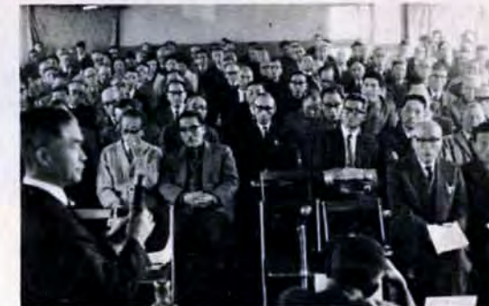
42年・「市長と語る会」スタート