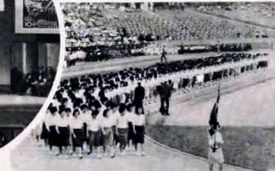
38年・第1回市民体育祭ひらく