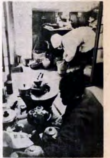
39年・ホームヘルパー制度発足