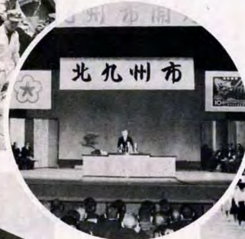
38年2月10日、開庁式。新しい市が、ここに誕生