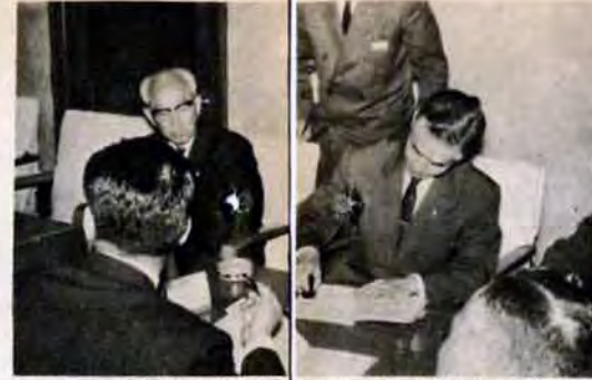
44年・公害防止協定第 号を戸畑共同火力と締結