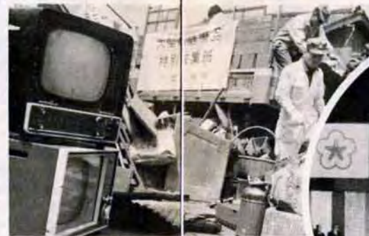
45年・大型ゴミ収集開始