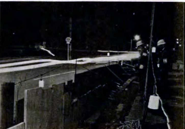
夜間パトロールでは、工事現場の保安灯などを調べる