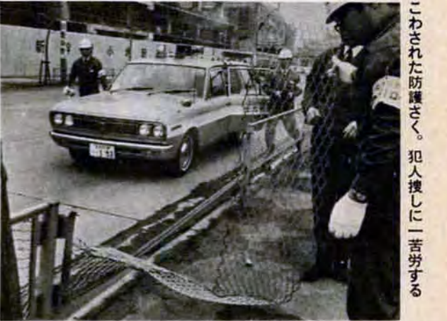
こわされた防護さく。犯人捜しに一苦勞する