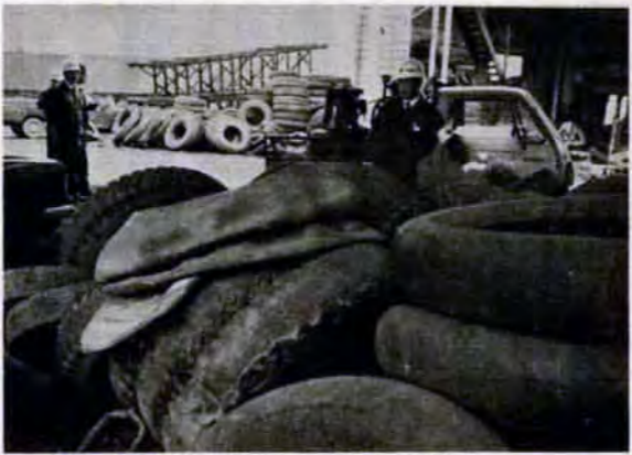
タイヤ置場になってしまった道路。さっそく使用者をさがし、注意する