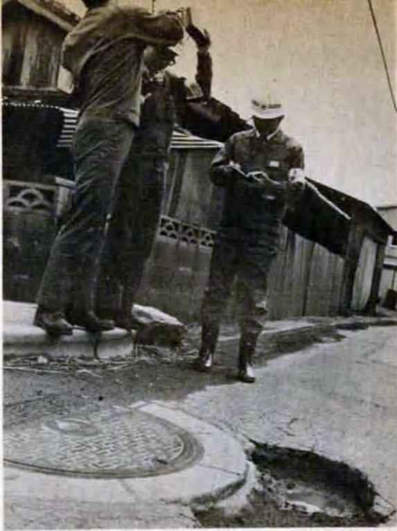
小さな穴も危険だ。単車がよくハンドルをとられる