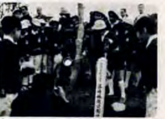
2月7日篠崎林間公園開園式

障害福祉センターでは、六十歳以上で脳卒中等の後遺症による身体機能の支障があつて、訓練により機能回復できると医師が判定した人を対象に、老人機能回復訓練教室を開きます。無料で。