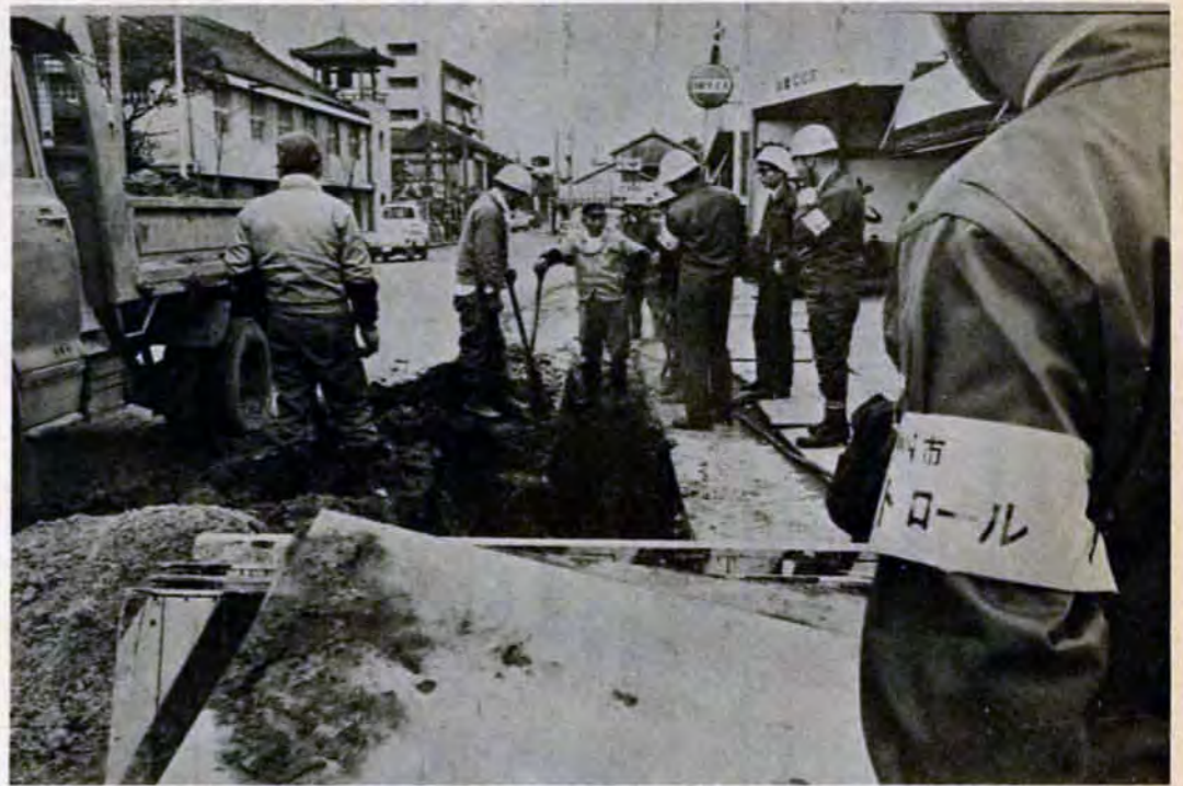
下水道の工事現場。工事のやり方に危険はないか、道路を不法に使っていないかなど調査する