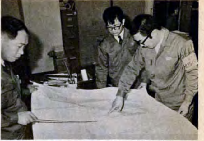
きょうは、この道路をパトロールだ。出発前の真剣なひととき