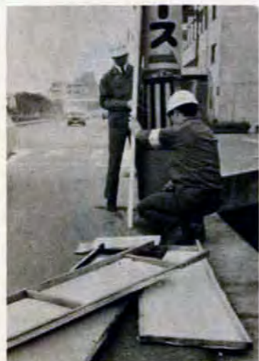
不法広告物の撤去も仕事のひとつ