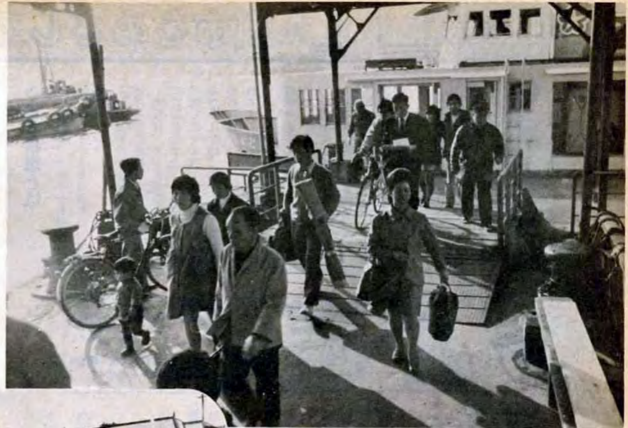
若戸渡船・さん橋で乗客が乗り降りする数分間が船員の休憩時間、食事やトイレもこのわずかな時間にすませる