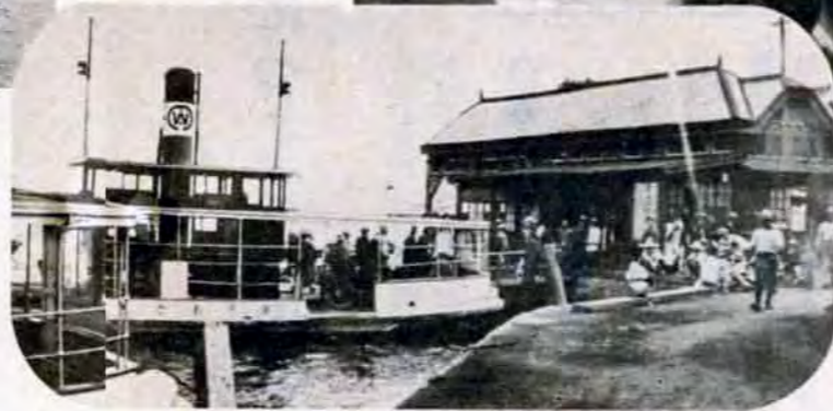
大正末期の若戸渡船