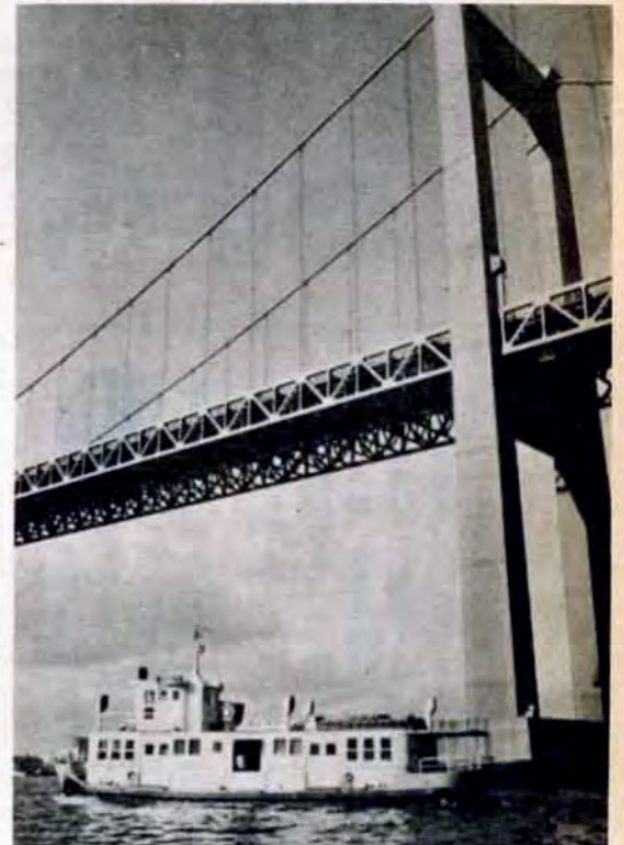
洞海湾の汚れのために、スクルーなどいたみが早い